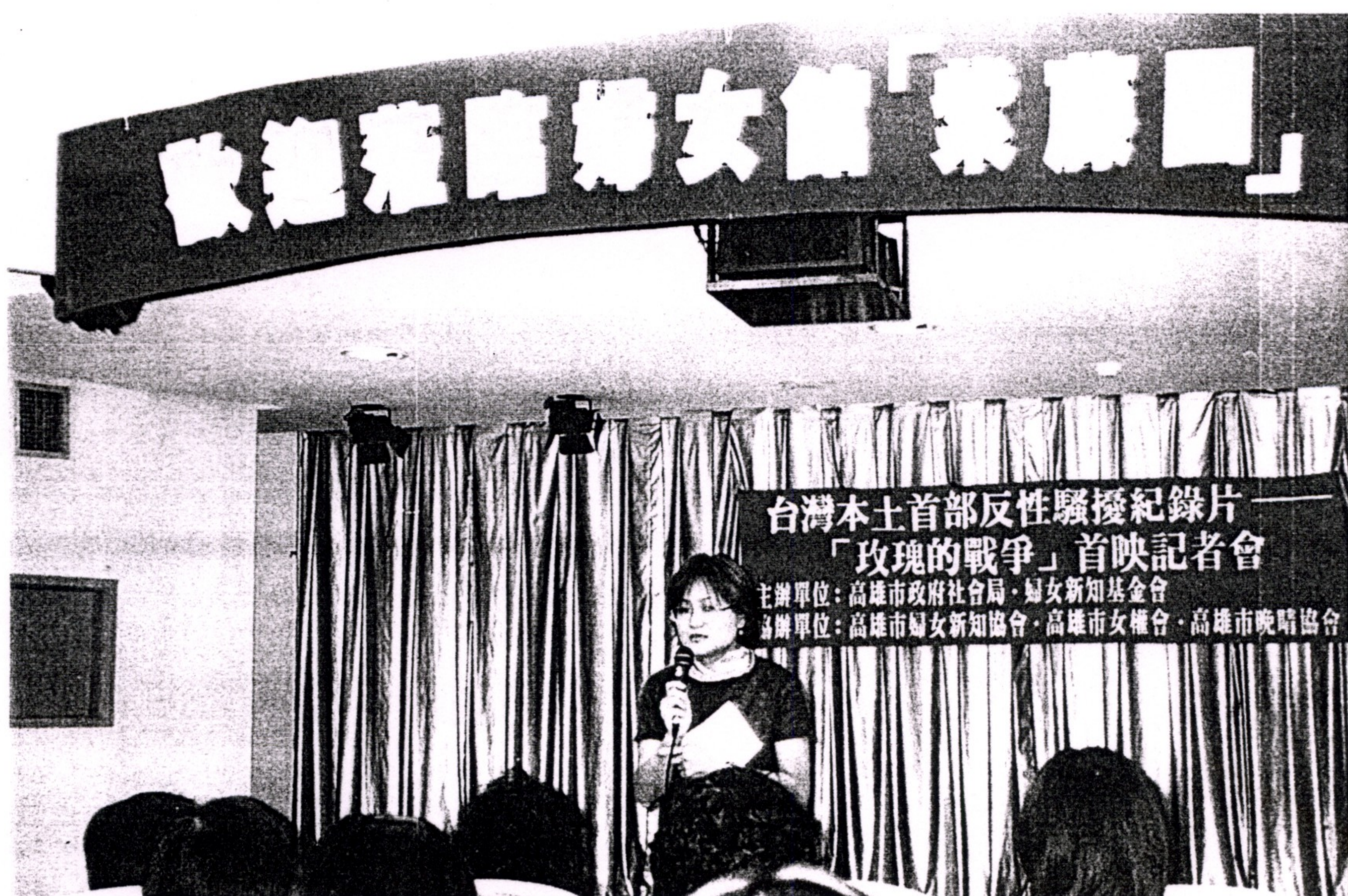
首映活動照片 2001.2.13 高雄首映記者會

受害人願意傾訴，有人可以 understanding 時是很重要的。但目前各校兩性平等教育委員會調查案件後只有建議權，也是未來申訴機制亟待努力的方向，我想每一次認真的對待，我們都在累積處理問題的實力，希望跟大家共勉之。