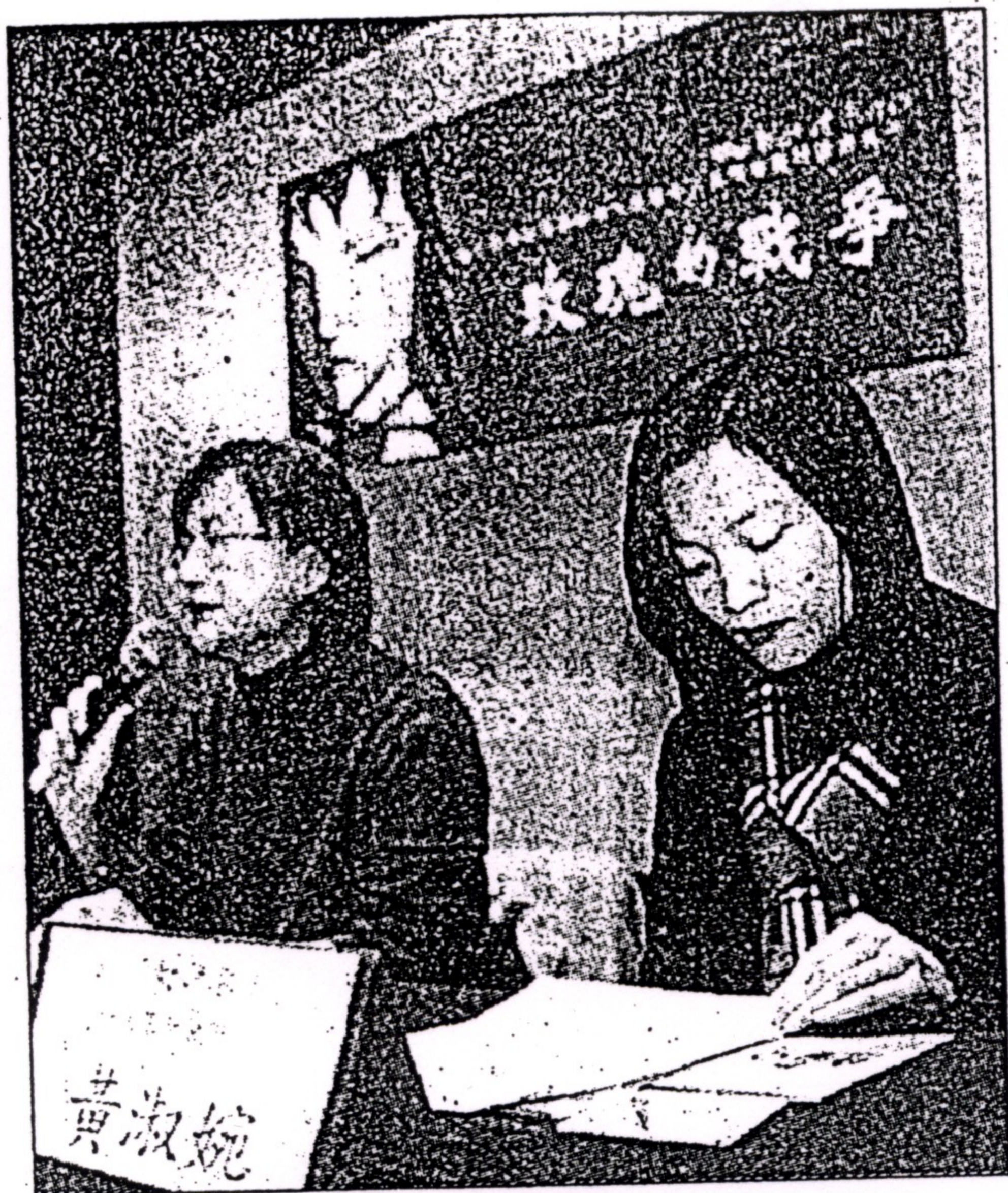
生命勇士 婦女新知基金會與紀錄片導演陳俊志合作籌拍反性騷擾紀錄片「玫瑰的戰爭」，昨日舉行首映記者會。

包括黃同學、楊護士、陳女士皆出席首映會，其中楊護士的先生及小孩也到現場打氣。黃同學表示，許多受到性騷