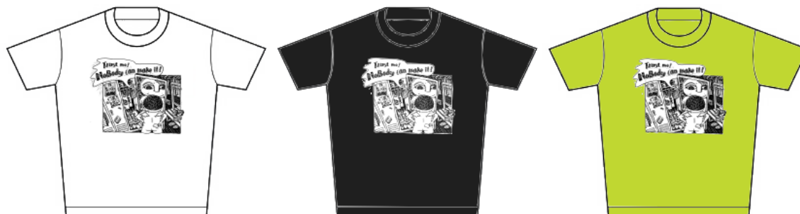
D 款-白 (男)