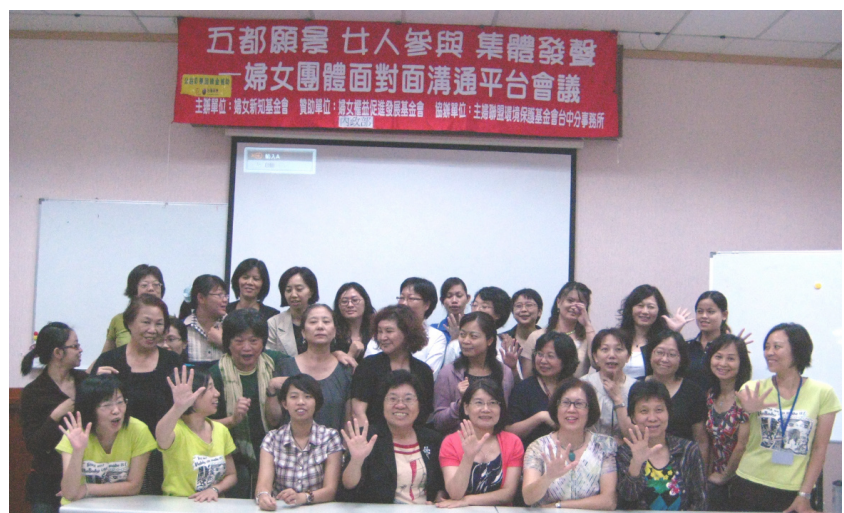
• 在場各婦團成立「五都婦女政策監督聯盟」，簡稱「都督盟」。

未來這聯盟，將先由在地婦團分別遊說五都各候選人簽署民間版的婦女政見，大約於11月初，五都婦團再聯合召開記者會公布各候選人的簽署情形。敬請期待，下回分解。