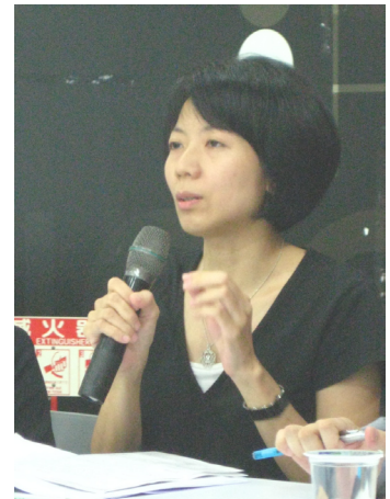
「刑法」、「性騷擾防治法」之整併建議