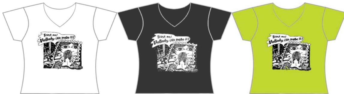
A 款-白 (女)