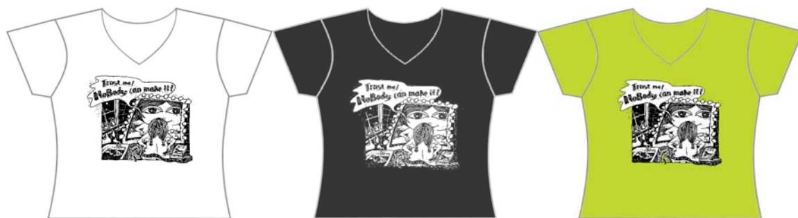
A 款-白 (女)