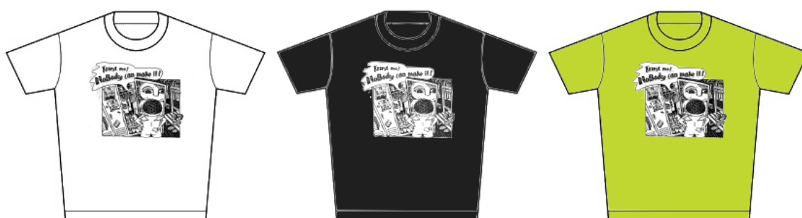
D 款-白 (男)