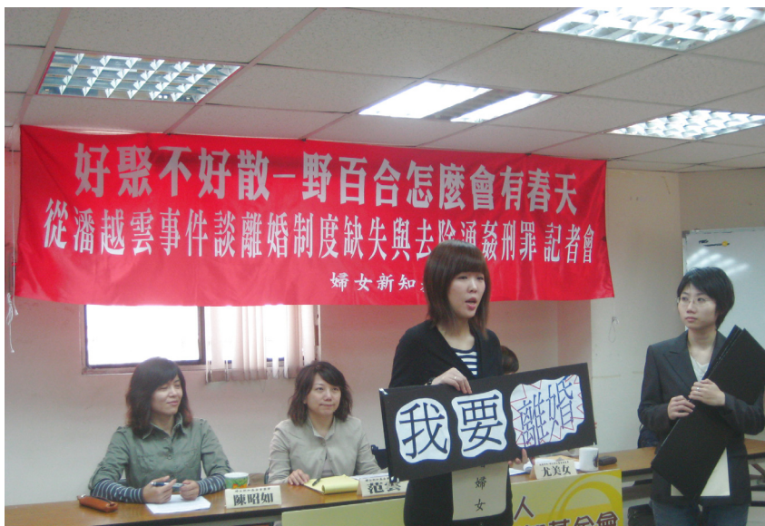
• 記者會上演出行動劇，諷刺民法1052條裁判離婚相關條文。

人在公開場合數落與言語攻擊其配偶，只為了達到離婚的目的？若當事人在這種兩難的情況下，與他人建立了親密情感，國家再用刑法懲罰個人情慾，真的合理嗎？台灣離婚制度長久以來的不合理，以及遲遲無法除去的通姦罪，這雙重桎梏等於是國家陷人民婚姻成為逃不出的煉獄，又耗費國家資源介入成年人情慾關係，逼使人民背負觸犯刑事法律之污名。好聚好散、和平分手，為何如此之難？