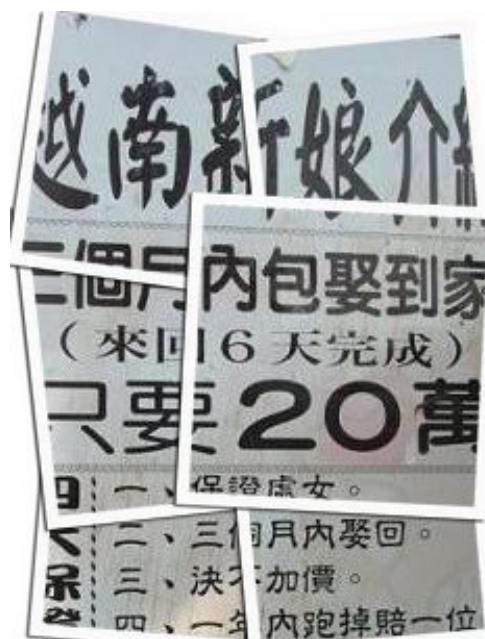
從2008年8月1日起，婚姻媒合不得再出現商業行為廣告。

近幾年來我們推動外籍配偶人權的修法已是阻力重重，大陸配偶更是兩邊政府都不愛不理的兩岸人球，未來移盟要推動大陸配偶的修法，在台灣特殊的政治環境下，可以預見將是更加困難重重。我下筆的此刻，民進黨已經又兩次阻擋大陸配偶的「兩岸人民關係條例」修正案，讓我們一直無法排入議程，也沒有任何一位民進黨立委願意支持移盟版。然而，婚姻移民與一般經濟性的移民不同，歧視她們、限制她們的權利，只會讓這些家庭成員一起受苦，更何況她們是貢獻台灣基層勞動的關鍵力量。我們堅信人權不該有國族之分，女性相挺女性，我們會繼續努力下去。