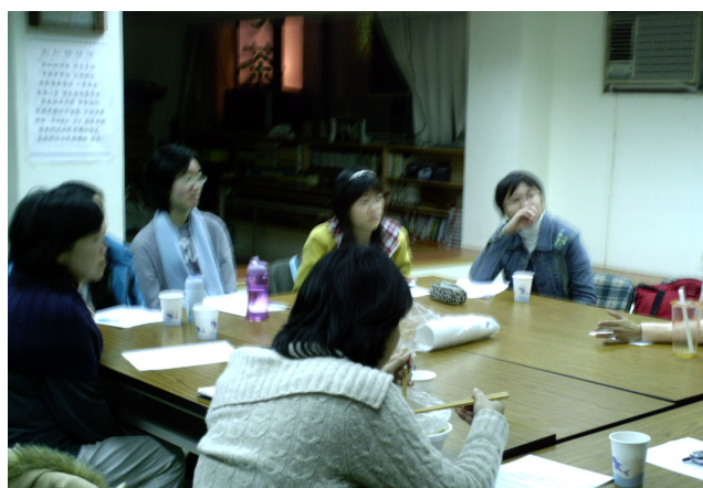
生育保健法 新知內部修法討論會議

因此，為維護女性身體自主權與重視青少年身心健全發展，未滿十八歲之懷孕未成年人應有多元管道進行中止懷孕之陪伴與支持。除了原有法定代理人之外，本會建議包括諮商機構、專業人員或四親等以內之親屬皆應納入其支持網絡中，擴大同意權範圍，對懷孕之為成年人提供實質的協助。