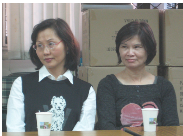
志工們聽課聽得非常入神

另外，每次在尋找使用Windows圖檔時，范雲發現圖片裡看到都是一群男人在開會，或是一群男人中穿插一個女人，卻看不到一群女人在開會！女性都是在做祕書或廚房的工作，而這同樣是性別偏見！藉由婦女運動的發展，女人才開始真正改變公共領域的政策，可是我們也會發現當其他議題與性別議題同時出現的時候，性別議題往往被擺在更不重要的位置。舉例來說：這次美國大選歐巴馬戰勝希拉蕊，便讓人感覺到，相較於一個優秀的白人女性，美國社會卻比較願意將國家交給一個優秀黑人來領導。也就是說一個白人跟一個黑人受到不平等的權力對待時，大家會很清楚得覺得不公平；可是當一個男性跟一個女性受到不平等對待時，大家反而會掉入錯覺似乎這是自然的性