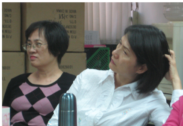
志工們專心聆聽著女同志的生命故事

透過不斷的溝通下，蛇發現父母親對於同性兩人之間彼此相愛沒有異議，但卻對於蛇參與同志運動難以認同。不過，在與父母分享了自己為何要參與同志運動的原因後，與家人之間的關係也隨之進入佳境。蛇為此做了一個結