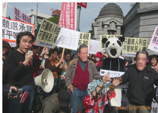
移盟與大陸配偶團體於台北賓館前抗議、演出諷刺行動劇

岸人民關係條例」修正案，總計修正十四條，委由徐中雄等立委在立法院展開跨黨派的連署與支持。對照之下，已經送進立法院的政院版本，卻依舊罩著歧視的框架，陸籍配偶與外籍配偶仍有明顯的差別待遇，而移盟版本在人權保障上，更可能全面性地解決陸籍配偶的居留、工作、繼承、家暴、社會福利等相關問題。