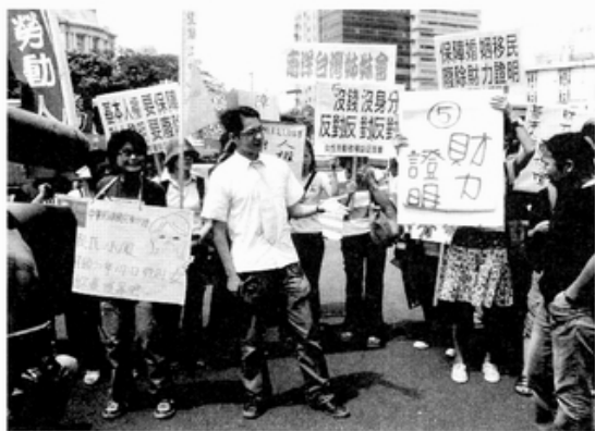
7月25日抗議記者會行動劇

徵四十一萬元財力證明的「借據」，於總統府前向「台灣之子」借錢，讓新台灣之子的媽媽們能取得身分證。