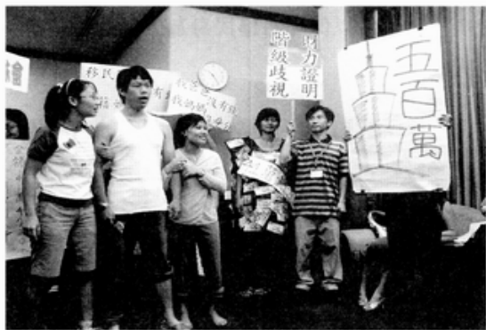
層出不窮的創意—8月8日行動劇