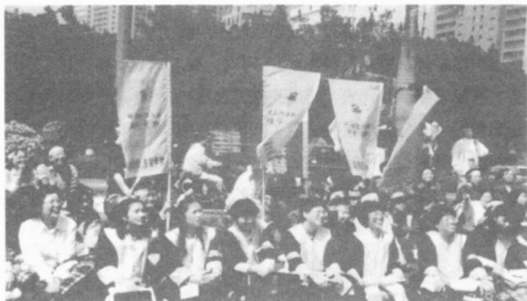
1992 婦女新知雜誌社；1997 婦女新知基金會；1997 婦女救援基金會；1998 臺北汙染諮詢婦女協會。 ——我們在這裡開始臺灣的婦女運動——

7月29日早上，陽光普照，好像也在慶賀這個特別的日子，今天，包括婦女新知基金會博愛路舊址台北六個在台灣HERSTORY上具有重要意義的地點，都要慶祝「女性文化地標」的揭幕了！