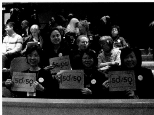
我們支持聯合國內部職員性別比例50:50！

安南一走，CSW繼續安排各專家學者引言，暢談對於各國在今年這兩大核心主題上的努力成果和檢討建議，做為婦女節的年度檢視主軸。有一位引言人就挑明的說，聯合國秘書長繼任人選，各國目前有浮出檯面的提名人選，全部都是男性！亦即，安南剛才的口頭支持，其實並無實質意義。