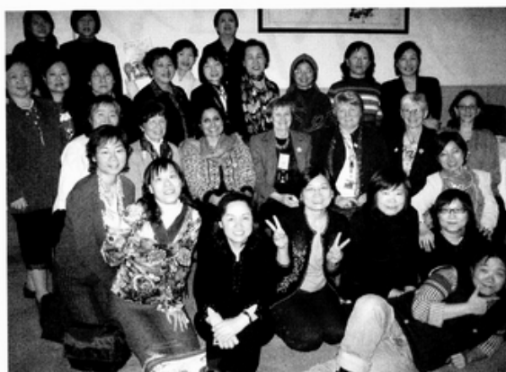
代表團和其它國家婦女運動大將合照

由於各民間組織往往限於經費困窘，不太能夠多支持工作人員出國進修、進一步建立國際交流，我在此也建議，往後可多增加民間婦女團體工作人員的補助名額，使關注各種性別議題的婦女團體代表，可有更多機會和資源來參加這樣的國際盛會。多多鼓勵婦女團體實務工作人員參加國際會議，將對台灣婦女權益工作，在建立國際交流管道和國內婦女人權推動上都有莫大助益。