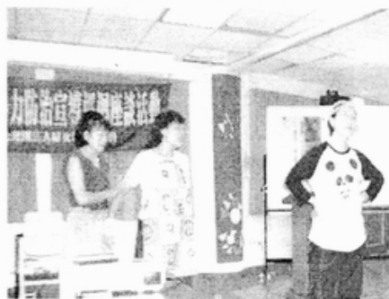
表演實況：兒子學習父親的不屑態度

基金會之女人戲法劇團所擔綱「家庭暴力防治短劇表演：這樣的日子要怎麼過？」的演出。志工媽媽們生動自然的演出，讓在場的學員皆能感受到猶如現實生活中家暴發生的過程，並從中發現傳統社會價值影響下家庭成員面對家暴時的迷思。