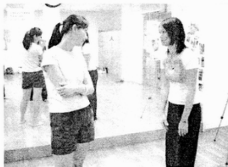
對戲中 正在說「不要」的人很有氣勢

練習的一開始，好像從中就可以看得出來姐妹們的性格，有人比較直接強勢、有人則是迂迴柔軟，看著其中一些姐妹的「死纏爛打」或「避之唯恐不及」，不禁讓筆者想到：該不會小時候也是這樣纏著爸媽買東西，或者是都是這樣拒絕小孩無理的要求吧？這麼駕輕就熟！