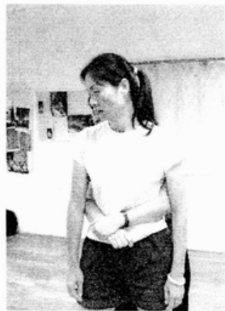
你看得出來嗎？抱住人的其實是說「不要」的人喔！

最後練習進入較為複雜的階段，這一階段，兩人都可以任意選擇改變立場，惟只要其中一個人改變立場，另一個人就必須隨之改變為相對的立場。這樣的設計，讓兩個人之間的關係的表現更加豐富，而老師在每一組的過程中，會針對每一組的表演，示範、或是引導志工不同的表演方式，並且和志工們討論：如何可以擴展自己對於關係、對於相處方式的想像，進而以不同的呈現方式，呈現出更大的戲劇張力。