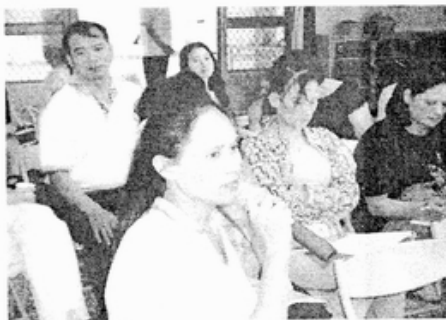
綜合討論實況：中區

此外，也有人提到通報者是否會被報復的問題，基本上通報人的身分是被保密的，然而在部落中也確實發聲因為人際關係的綿密，以致於警察把通報的人名出來，使得通報人必須離開的現象。因此通報需要一些技巧，比方說他們常常吵架，請警察去看，而不事直接說有家暴，可以用妨害安寧的理由去跟警察說。