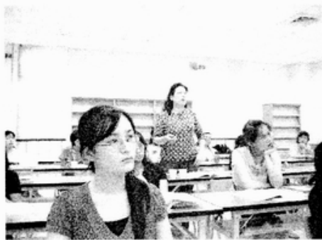
綜合討論實況：北區

北區綜合討論部分，許多老師提出當她們遇到孩子身上有傷時，要如何評估與處理的實務問題。包括學校是否需要拍照存證害是只要通報，或是碰到家長指責其誣告時的因應方式，與談人則提供可能的處理方式包括：如果家長在家中摔砸物品，雖然沒有真正打到孩子，但仍對孩子造成影響，例如目睹家人受虐，這也是要通報的。而通報時可以清楚地將孩子遭受到的