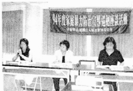
實務研討實況：南區

針對家暴防治措施與各案協助的實務研討部分，則邀請到各區專門從事家暴個案服務的社工員、督導以及專業教授等學員提供其實務經驗與發現到的相關問題，包括目前各公部門包括社政、警政、衛政、司法、教育單位的本位主義，致使需要各環節緊密合作的家暴案件無法有效的預防，或是無法及時處理（例如警察人員無法有效制止施暴者的再次施暴），甚至是受暴後發生沒有及時通報的個案。另一方面，施暴者的處遇和受暴者的諮商缺乏充足的資源，處遇亦未徹底執行。