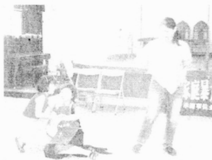
劇團表演實況：父親施暴