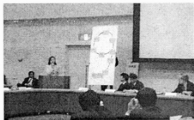
各國與會代表共同署名支持「反對修改日本憲法第九條」

除了議題討論外，如何將此次會議的成果公開發表，讓更多人知道並參與共同行動亦是此次會議重要目標之一。主辦單位除了安排日本當地的媒體訪談，舉辦發表記者會外，更重要的是規劃公共論壇，邀請關心此議題的一般民眾共同參與。在公共論壇的討論過程中，各焦點城市除了發表相關議程行動外，更重要的是在報告完後的集體行動。用一張張宣言拼成一個 9，共同表達對日本憲法第九條修正的強烈關注。此一行動不僅是東北亞和平行動議程的宣告。也開始了東北亞關心和平議題的民間團體的第一步串聯，為日後的和平行動開啓序幕。