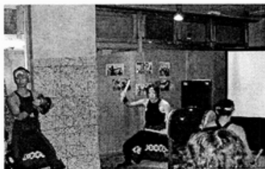
和平船工作人員帶來的“鼓舞”

晚上在主辦單位和平船（Peace boat）中心的活動，則讓與會者體驗到這個組織的旺盛活力。Peace boat 利用經營郵輪旅行活動，在船上提供各式各樣有關和平主題的活動。除此之外，她／他們也利用停泊世界各港口的機會，實地到需要協助的地方去提供第一線的支援。靈活具有創意的組織經營方式，相信是台灣非政府組織一個非常好的學習模式。