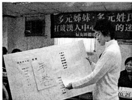
模擬外籍姐妹被音譯為荒謬的中文名字