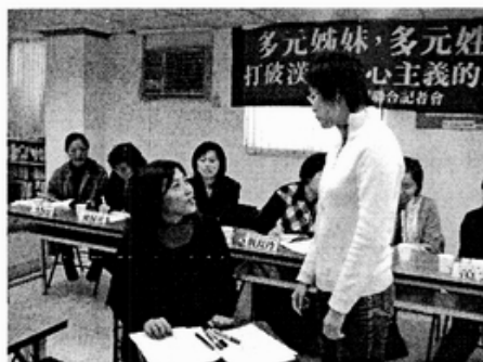
模擬外籍姐妹至戶政事務所登記姓名