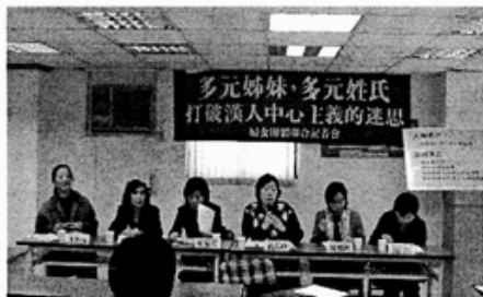
主持人說明記者會主要内容

年行政院公布「修正台灣省人民回復原有姓名辦法」，將台灣原住民族全部改為漢姓漢名，以致出現戶政人員隨興音譯而將同一家族登記不同漢姓的荒謬現象，完全不尊重各族原有的命名慣例。