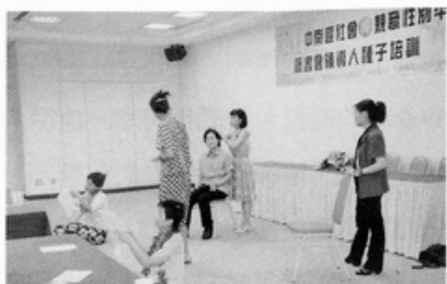
(1) 中南區社會與親職性別平等教育讀書會領導人種子培訓營 2003.9.17 台南縣