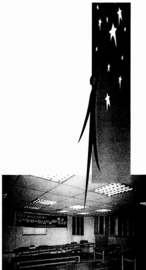
記者會活動現場佈置 2003/8/3

年邁父母的家庭重擔，進入更年期解除生育焦慮後，這些「資深女郎」能更勇敢的開創下一階段的人生，「為自己活」的人生！▲