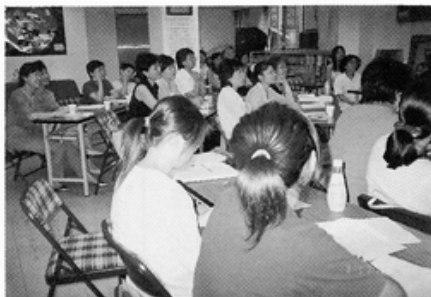
志工健康講座活動照片(2) 2003/7/17