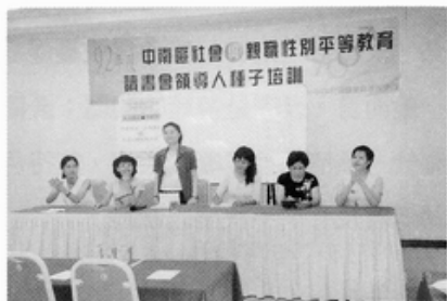
(2) 中南區社會與親職性別平等教育讀書會領導人種子培訓營 2003.9.17 台南縣