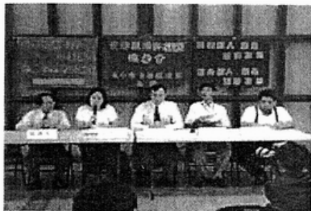
社會安全防疫聯盟成立記者會

台灣人權促進會、台灣促進和平基金會、婦女新知基金會、性別人權協會、工人立法行動委員會、愛滋感染者權益促進會、台大社會系台灣社會工作小組、台大醫學系 SARS 學生工作小組。