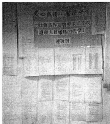
來自各界之連署書如雪片紛至