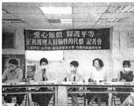
各團體代表出席記者會