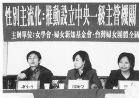
0307 「性別主流化：推動設立中央一級主管機關」記者會