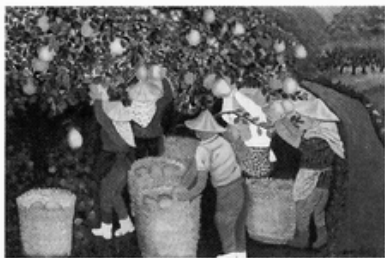
李涼女士畫作：中秋節到了摘柚子 /2001/15F 油畫

感謝所有的親朋好友，如師大施並錫教授、朱銘先生、宜蘭的親人、鄰居莊三媛老師、彩陽畫會的朋友們、晨光早覺會手語班的學生、社區的氣功學生等，給予母親的許多鼓勵與祝福，在此一並致謝，並祝 母親畫展成功。▲