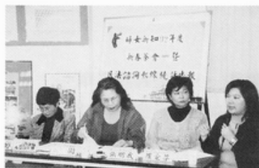
92 年度新春茶會暨民法諮詢熱線統計報告