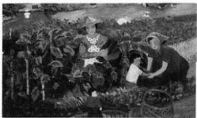
李涼女士畫作：農忙時節/1999/15F 油畫