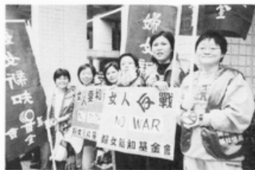
0215 反對美英侵略伊拉克戰爭聯合行動