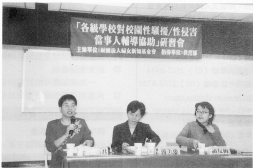
各級學校對校園性騷擾／性侵害當事人輔導協助研習會