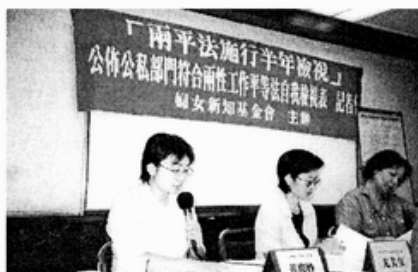
▲「兩性工作平等法施行半年檢視」記者會