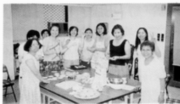
志工姊妹桿麵包餡，忙得不亦樂乎！