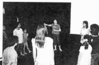
▲原住民婦女生活戲劇工作坊