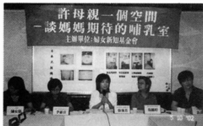
照片說明：當日記者會實況

此，常常乏人使用、空養蚊子，其實，應該設計為一個通用空間，讓懷孕母親或是生理期女性都能利用該空間；最後，有些哺乳室的設置是位於化妝室隔壁，因此，衛生清潔等相關工作就必須特別加強，以免負面地影響到母親哺乳，導致哺乳室的使用率下降。