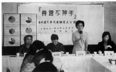
照片說明：記者會實況