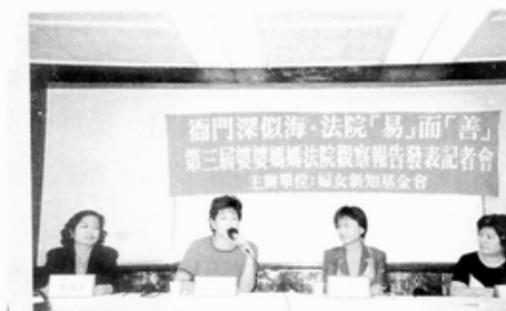
照片說明：記者會實況

婦女新知基金會進一步指出，婦女團體致力推動民法親屬編修法，以努力破除長久以來父權為中心的法律規章，但是對於因為性別與階級造成的差異對待，則需要司法人員更敏銳的洞察與自覺。或許因為法官的工作負荷量重，時常面對重複的問題，所以感到不耐，但是對一般民眾而言，面對多如牛毛的法令、專有名詞、及司法制度，除了陌生只有畏懼，若是遇到抱持「專業權威」的法官，讓人加深挫折與無力感罷了！以往「法不入家門」的觀念影響及民法親屬編中仍有許多違反兩性平權原則的法條，使家事事務的處理並不近人意，除了修法迫在眉睫，現行家事事務的審理制度更應作大幅度的調整，因為單單只進行法律訴訟並不能解決家庭中所有的問題，而需要連結各項社會資源，整合各種專業的判斷與服務，才能全面而有效的處理家事事務。因此，催生一個更人性、更符合家事事務特質的家事審判制度，成立專門法院，由（具備教育、心理、社工專業）的「調查官」、「調解員」先彙整案情相關資料，以減輕法官的負擔，因此，建立一個維護個人尊嚴、重視兩性平權的訴訟程序，絕對是一項刻不容緩的工作！ 2001.10.23 新聞稿