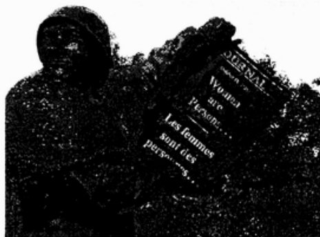
說明：女人一路走來，十分艱辛漫長。

虛擬大學的好處是跨越時空限制，但經濟卻是一個須克服的因素。版權問題，新的學習態度以及個人之學習表現及資格授與如何評估等，確保虛擬大學之教育機會對女性平等開放並檢視其品質，都是應該受到重視的問題。（未完待續）