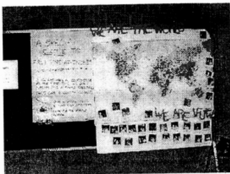
說明：IFUW 的會員國有七十一國，遍及世界。

七月初，我以獨立會員的身分（independent membership）申請加入 IFUW，得知 IFUW 即將於八月份在加拿大沃太華(Ottawa)舉行第二十七屆三年一度的研討會，時間雖緊迫，但因等到下一屆研討會還需三年，我還是決定前往參加，親自去了解這個組織以及她所做的事。