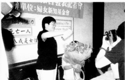
照片說明：記者會實況。