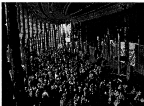
說明：於文明博物館 Museum of Civilization 舉行的加拿大之夜 Canadian night

女性在全球化的趨勢中，對於資訊與通訊方面之科技(ICTs)，必須擁有自信與能力。全球化也造成權力的重組與改變，誰掌握資訊與高科技，誰就擁有權力。女性必須體認這個事實，加強資訊識讀教育(information literacy)，社會與國家也應賦予女性平等充分的學習機會，資訊高科技的設計也應符合女性的需求。