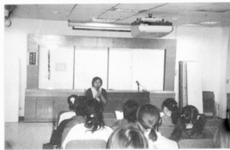
照片說明：校園巡迴實況。