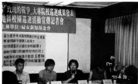
照片說明：628 記者會實況。