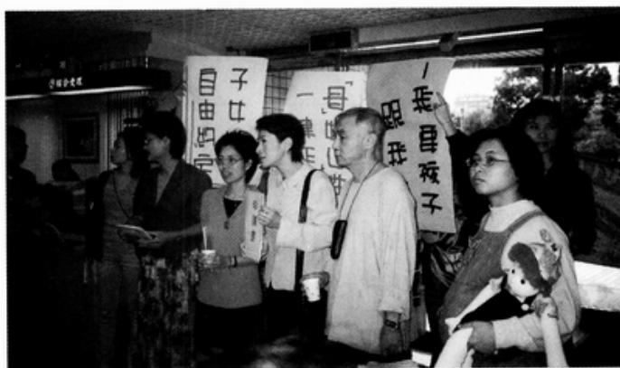
照片說明：子女從母姓記者會（進入戶政事務所）