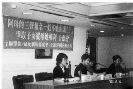
照片說明：6/6 公聽會現場

四、其他：（1）孩子想從母姓：9.76%（2）找不到前夫：7.32%（3）時效問題：3.66%（4）行政問題：2.44%（5）母過世：1.22%（6）原住民：1.22%（7）國籍法：2.44%。