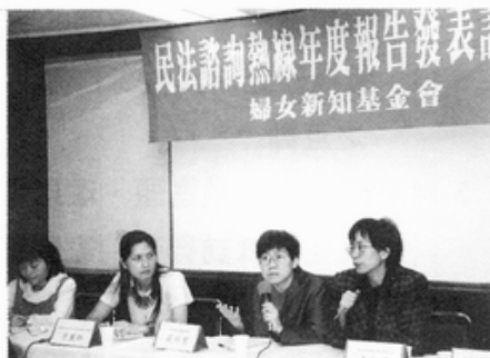
3. 17「女人·法律雙叉路」民法諮詢熱線年度報告發表記者會