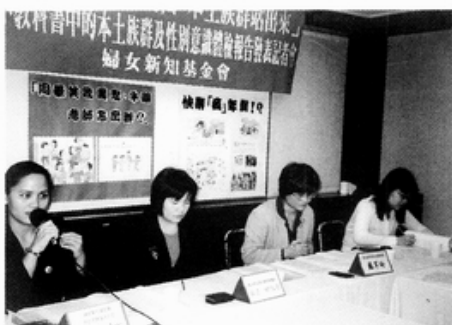
3. 28 國小教科書族群與性別意識體檢報告發表記者會