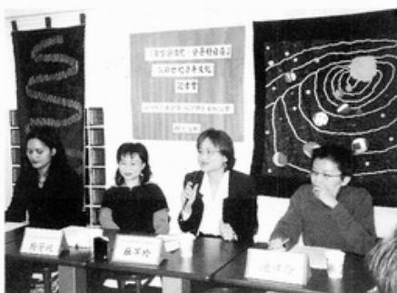
2. 10「聚首圓滿意、分手好自在」記者會