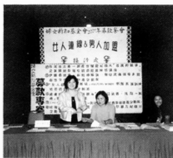
3. 31 募款餐會—接待台