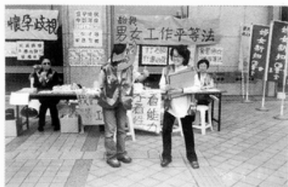
1999. 5. 1 催生男女工作平等法街頭連署活動