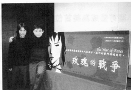
「玫瑰的戰爭」導演陳俊志