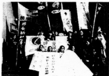
婦團保衛婦女預算立院記者會