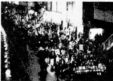
「女權火、照夜路」大遊行

年在校園又爆發師大教授強暴女學生事件，女學會與葉菊蘭立委在立法院召開「校園性暴力公聽會」，全女聯發表「女大學生權利宣言」，現代婦女基金會也草擬「性侵害犯罪防治法草案」，新知、女學會與各校女研社在 522 發起「女人連線反性騷擾」大遊行，抗議教育部漠視校園性騷擾，女學會也在遊行後繼續召開落實性侵害及性暴力防治公聽會。不幸，1996 年底，民進黨婦女部主任彭婉如在高雄夜間回飯店疑遭計程車司機姦殺，婦女團體南北串聯，發起「女權火，照夜路」大遊行，立法院始快速通過「道路交通管理處罰條例第 37 條」 7 與「性侵害犯罪防治法」，教育部也成立以教育部長做召集人的兩性平等教育委員會。目前台灣社會已視性騷擾與性強暴為性侵害事件，加上婚姻暴力，皆是危害婦女人身尊嚴與安全的大事，政府與社會不再漠視。