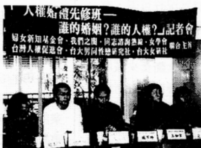
『人權婚禮先修班—誰的婚姻、誰的人權』記者會