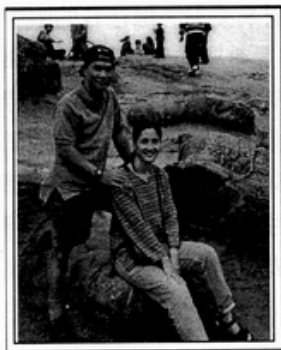
（麗群和她先生合照）

1998年9月加入了新知民法諮詢熱線的志工培訓課程。選擇法律方面的服務工作，其實是我多年來的心願。自從大學畢業踏入社會以來，才突然發現現實的生活當中，女人的地位，和她所受到的教育和訓練，完全不搭調，社會上到處都充斥著男尊女卑、父權為大的觀念，即使在家庭裡也一樣。這對於當時的我來說，是一個很大的打擊，無法理解也不能接受，因為在我的原生家庭中，父母完全沒有重男輕女的觀念，甚至於三女一男的小孩中，父親還特別寵愛我們這些女生。剛踏出校門就進入婚姻生活的我，不甘於處在