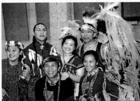
(照片正中間的漂亮女生就是阿洛呦！)

30 位來自台灣各族群原住民學生，在去年行政院原住民委員會（簡稱原民會）所舉辦的全國原住民大專青年會議中（MANASKAL）被甄選出第二屆原住民學生國際交流的代表，並在屏東文化園區，經過一個星期的歌舞練習及課程訓練後，代表台灣原住民加拿大與當地的「印地安人」和「愛斯基摩人」展開一場跨國性的「原住民與原住民的對話」。