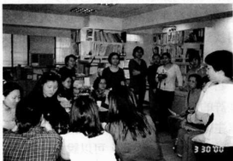
（2000.3.30 CAW 會員參訪新知工作室）

從各國簡介自己國家的經驗來看，雖然各國國情不同，但是所面臨到的女性工作問題，如：懷孕歧視、年齡歧視、兼職工和契約工逐漸增加的趨勢及惡劣的工作環境等問題卻沒有多大的分別。其可能原因是全球化的影響，企業家紛紛將勞力密集的產業外移至勞動力低廉的國家，如：中國大陸、菲律賓等；或是大量引進外勞以取代昂貴的本地勞工。然而，如此產業結構的改變，首當其衝的即是從事第一線工作的女工。大量的女工被裁員，或是轉而從事沒有福利保障的兼職工作、契約工作。為因應這樣的轉變，日本、韓國及香港均