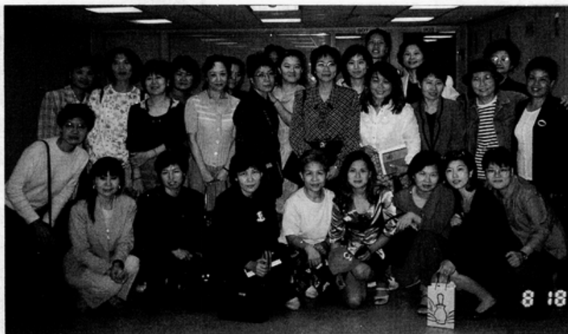
攝於新知第二屆志工大會

五年來，每一個打電話進來的婦女，都有一個悲傷的故事，線上的婆婆媽媽詳盡的解答，無不是希望能帶給她們對抗父權的力量。雖然，婆婆媽媽們的辛勤付出和現有的修法成果不成正比，但我們非常珍惜現有的修法成果。我們也將持續推動民法親屬編的修法運動，督促立法院儘快廢除以夫為尊的聯合財產制，建立一個重視兩性平等財產權的夫妻財產制度——「所得分配財產制」。同時，我們也希望在夫妻財產制修法之候，立法院能儘早修訂現行的離婚法，讓兩性都能享有平等的、自由進出婚姻家庭的權利，而非被一紙結婚證書網綁一生！