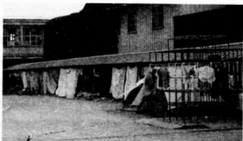
學校停車棚成了災民臨時住處，每條棉被的後面，住著一個無家可歸的家庭。

從災區回來，我的腳軟軟的，不是因為要站十幾個小時的服務而累壞的；我的手軟軟的，不是因為一天要切那麼多菜或清洗大的鍋盤而酸透的；我的心一直都是冷冷的；朋友說，妳不舒服嗎？是的！自從災區回來後，我已經找不到笑的理由了。我在想著福爾摩莎的將來，我惦記著今年的中秋月夜何時了？我更擔心是，如果連這樣大的震災也震不醒人們共體時艱的同理心，這場浩劫不知何時才能結束啊！