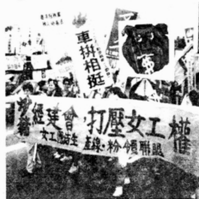
經濟發展建立在剝削女工之上?

我們必須反對一切對女性進入工作職場的限制與歧視，反對對於女性工作者個人以及女性集體的權益侵犯。在今年，我們將持續推動「男女工作平等法」的立法工作，並特別著重工作職場性騷擾問題，督促政府以及企業單位制定明確的性騷擾防制政策。