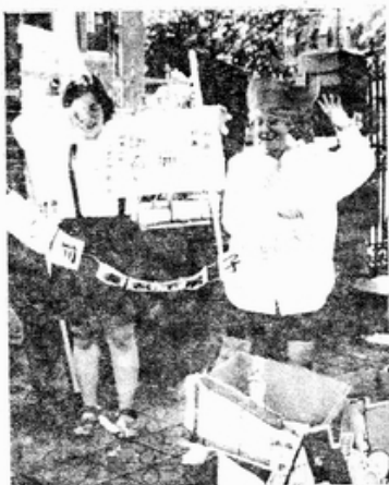
民法公然剝奪婦女權益 隨處可見

今年我們將與政府主管機關及各單位業務執行人員，共同合作擬出具體的執行方案，以切實做到使婦女朋友能夠迅速、方便而有效的掌握並使用社會資源網絡。同時，為免除個別婦女尋求援助的孤立，將延續「受暴婦女支持小組」的計畫，陪同婦女一起尋求醫療、警政、社工等相關單位的協助。我們將致力於消除暴力對婦女、兒童的傷害，要求施暴者為其暴力行為負責，並改變社會大眾對暴力的漠視與錯誤的認知，更將站在受暴婦女立場，以受暴婦女的需求為先，提出對於家庭暴力防治政策的呼籲和建議。