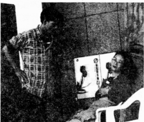
· 婚姻暴力展現了權力的不平等