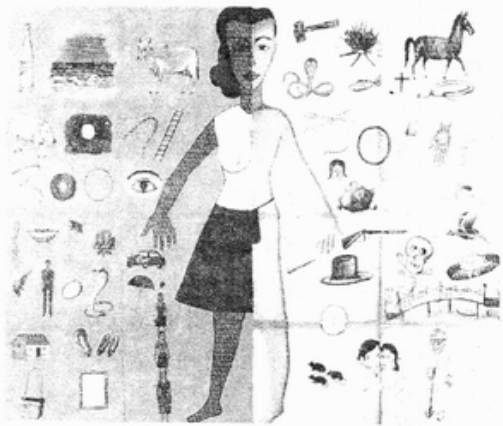
刻板性別教育可休矣！

父權社會為了維繫既有的男強女弱不平等社會結構，透過性暴力事件作為其恐怖統治的手段。性暴力不僅帶給婦女心理上的恐懼，更具體造成女性身體上的直接傷害。父權社會一方面在心理上、身體上「弱化」女性，一方面用性暴力恐嚇女人、限制女人的行動自由，讓女人喪失夜行權，必須囚禁於家中。社會更將性暴力事件歸罪於個別婦女，污名化受暴婦女。當務之急是女人應集結起來，共同破解父權社會恐怖統治的伎倆，將性暴力形成的結構原因揭露出來，要求現行法律制度、教育制度、警政、司法制度徹底改變，並發展出女人個人的防暴策略，以反抗制度性暴力。