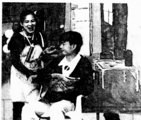
· 夫妻越打，感情一定越濃？