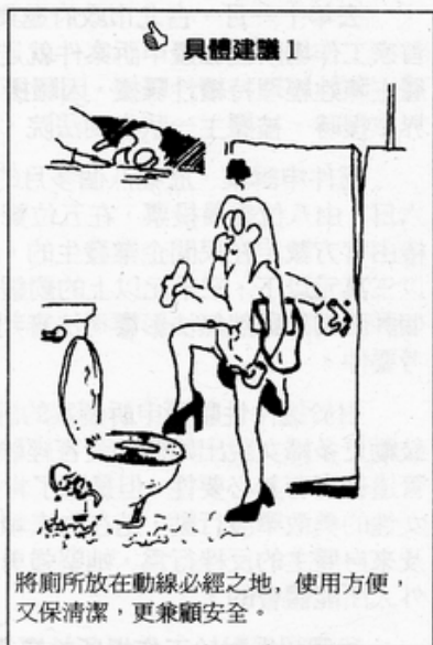
將廁所放在動線必經之地，使用方便，又保清潔，更兼顧安全。

根究其因，正是女性被排除於空間規劃之外，在提案、設計、決策的每一個環節上，女人都是缺席的，於是女性無法在空間使用上佔優勢，無法成為改變空間的主導者。