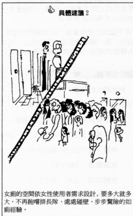
女廁的空間依女性使用者需求設計，要多大就多大，不再飽嘗排長隊、處處碰壁、步步驚險的如廁經驗。

這次由大學女生發起的「搶攻男廁」活動，可說是首次女性使用者對抗／挑戰男性專業的集體行動。這個行動，不但把廁所議題從“不登大雅之堂”中解放出來，也讓女廁不再與“骯髒”劃上等號，更使女性使用者去污名化。