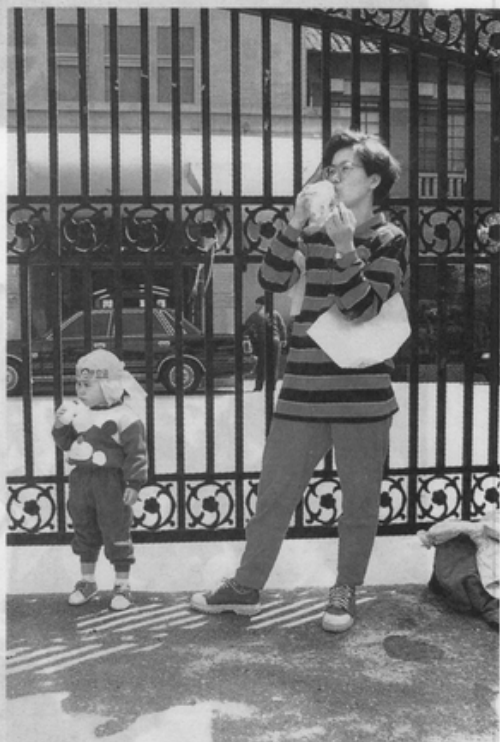
兒童也要支持修法