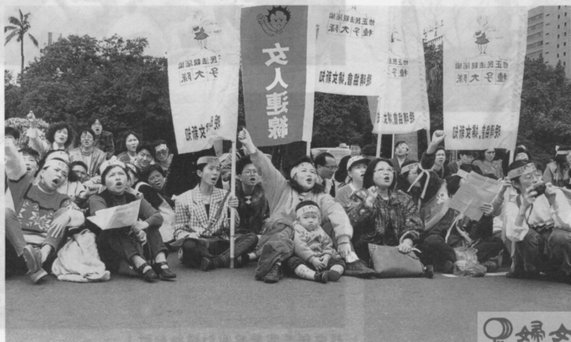
女人連線，希望無限！