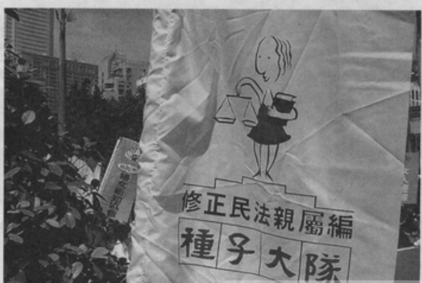
修法律師們，辛苦了！