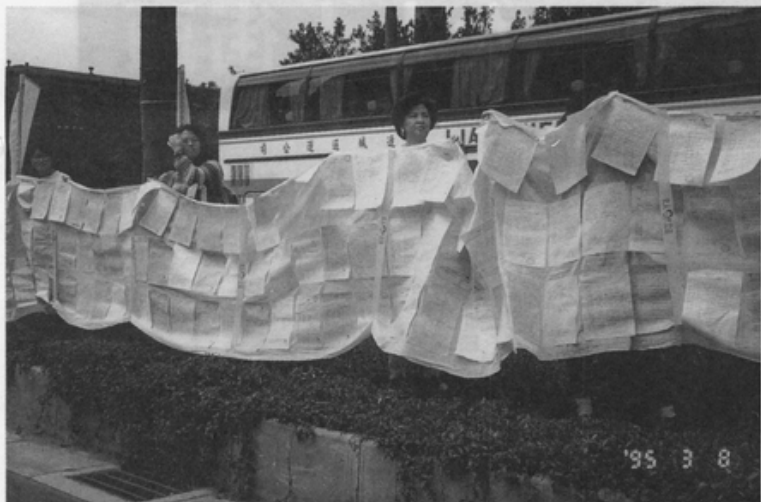
支持修法連署已超過三萬人，公不公關