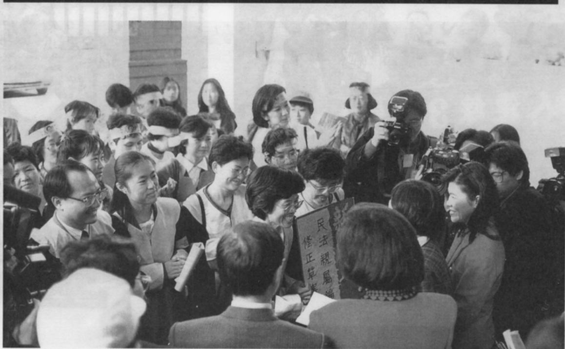
律師團與新知、晚晴的董監事和理監事將「新晴版」送入立法院