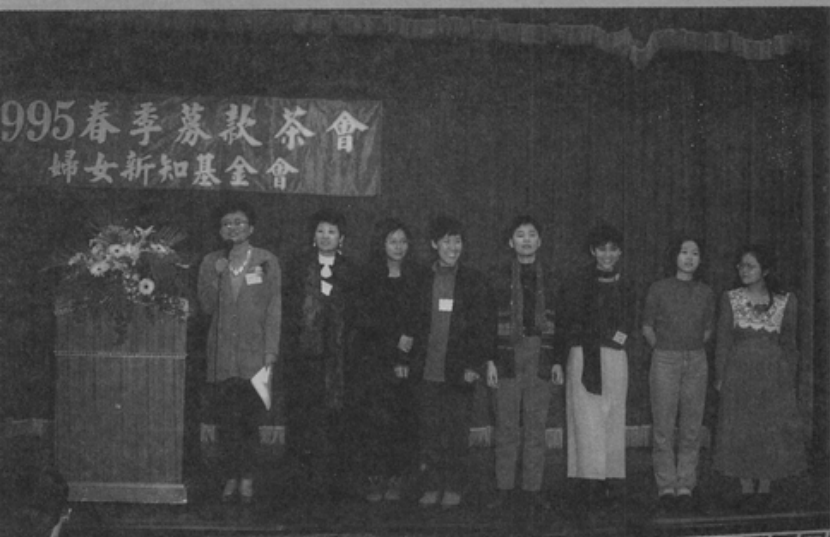
○全體工作人員上台致意