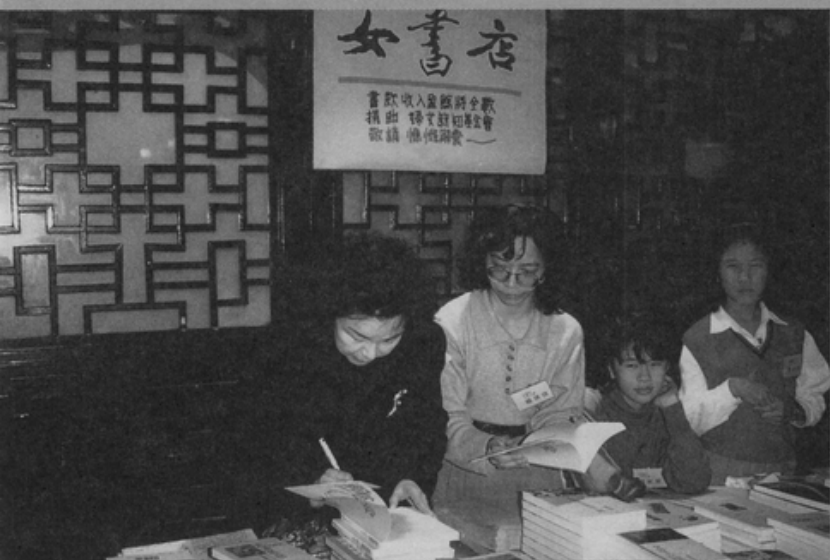
○女書店將義賣書籍所得捐給新知