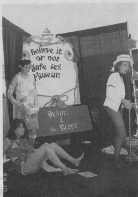
⑤舊金山愛滋病基金會的安全 性行為表演劇場“現代版美 女與野獸”