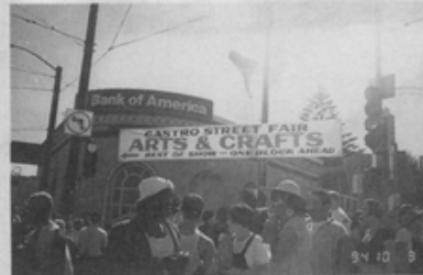
③④Castro Street Fair 的參加人潮