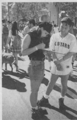
②AAP 的工作人員進行問卷調查