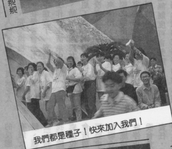
我們都是種子！快來加入我們！