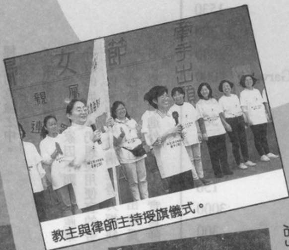
教主與律師主持授旗儀式。