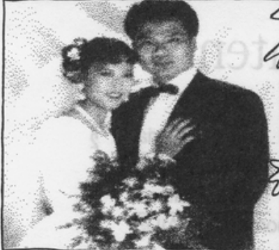
打老婆的三階段循環與 中華民國警察的嚴正立場。