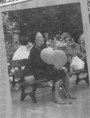
活了這麼一把年紀，終於有人要修法了。