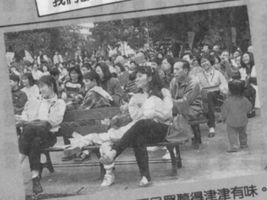
台下民眾聽得津津有味。