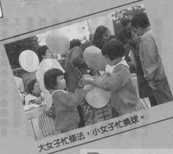
大女子忙修法，小女子忙換球。