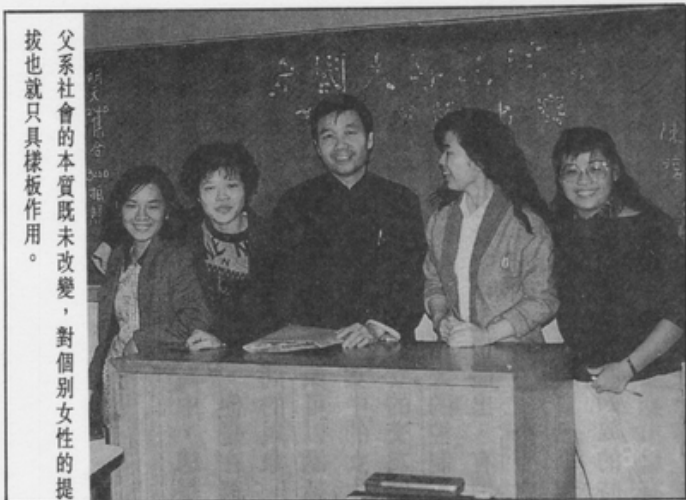
父系社會的本質既未改變，對個別女性的提拔也就只具樣板作用。

被教導，這一路挨打的局面，女生除了採取守勢或選擇依附所謂強者（男生），她實在看不出還有那條生路。