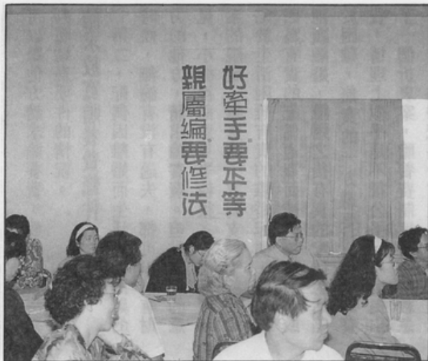
好牽手要平等 親屬編要修法

都會一無所有？所以，第二部分就是有關離婚後法定效果的檢討，基本上我們認為，現代的婚姻法應該不單是屬於私益的色彩，應具有公益的色彩，在子女監護方面，應該是以子女本身的利益來作為衡量的要點。因為現行法規規定，兩願離婚就子女監護原則上是由夫任之，所以說現行法以父親優先的思想已經不符合立法的趨勢，特別在兒童福利法通過的時候，也認為在子女監護方面，應該以子女利益作為判斷標準，而不是小孩子當然的監護權就是歸父親或是歸母親，所以本草案在監護方面的修正，有下列幾點的特色。