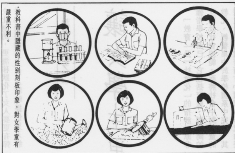
教科書中隱藏的性別刻板印象，對女學生有嚴重不利。

勞動力中的婦女分工。所謂教師的態度是指，教師通常相信自己對男學生、女學生的態度是沒有差別的。而事實是，學校歷程，對女學生有嚴重的不利。資源的配置是指，不均的教職員配置（男校長、女老師；男理化老師、女國文老師）；教科書中隱藏的性別刻板印象；及不同性別的不同修課課程（工藝—家政；軍訓—護理）的規定。最後一