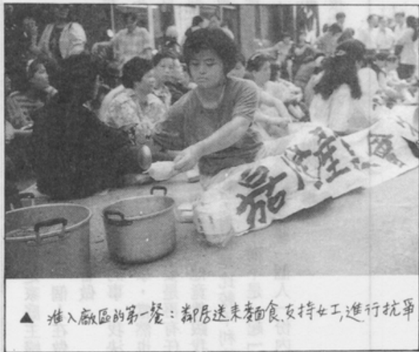
▲ 進入廠區的第一餐：鄰居送來麥面食支持女工進行抗爭

中午過後，大夥也休息了一會兒，但抗爭的情緒依然高昂，她們唱了幾首改編的流行歌曲，歌詞也許不押韻、不對仗，但它確實道出了她們心中的話。一名年約二十歲的女工告訴我，她來嘉隆成衣廠已經快四年了，這四年來她爲了省錢寄回家裡，她只好住在員工宿舍，宿舍的條件實在是很差，所謂的宿舍也不過是違章建築的頂樓，炎熱的夏天裡只有一支風扇可用，在五、六坪大的房間，卻要容下近十名的員工，這樣的生活實在不是人過的。談到這裡，我問她叫什麼名字，她打開她的背包，小心翼翼地拿出她的工廠識別證