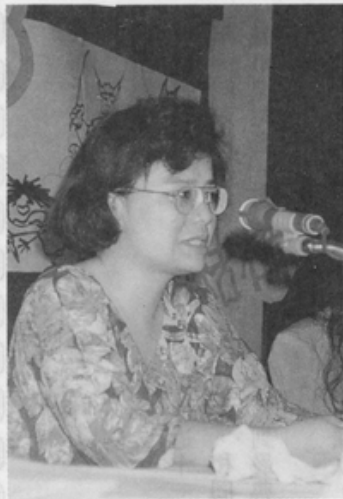
挺身而出反遭羞辱