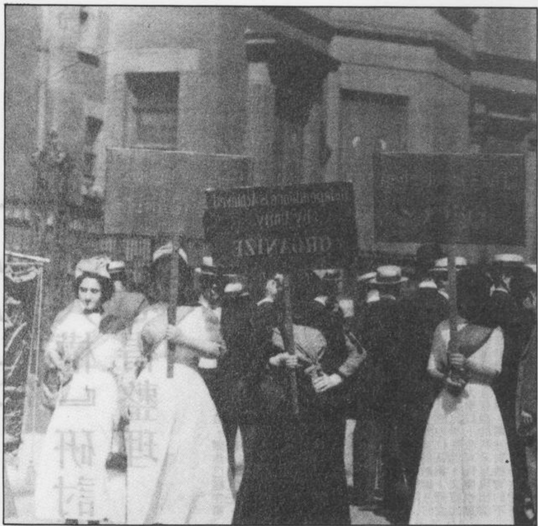
二十世紀初年英美婦運爭取投票權示威。

抱婦女保障名額不放」的既得利益者！但是，我要在此引述前一堂工作坊討論的平等權的真義，那就是：凡相同者即予以相同的待遇，但是，對於不同者、有差別者，則應以差別待遇對待之。 而差別待遇又分為兩種： 一是歧視：用以否定並剝奪差別者的基本權益。 二是鼓勵措施：如呂女士所說的「提昇辦法」，是用以保障差別者能在基本權益上受到維護，如生存權、教育權、人身安全、自由權……等，使之不因其差別——可能是生物的、天生的、或是人爲的——而無法享受與其它人一律平等的待遇。 婦女保障名額應當是鼓勵參政而不是限制、壓低婦女的參政機會