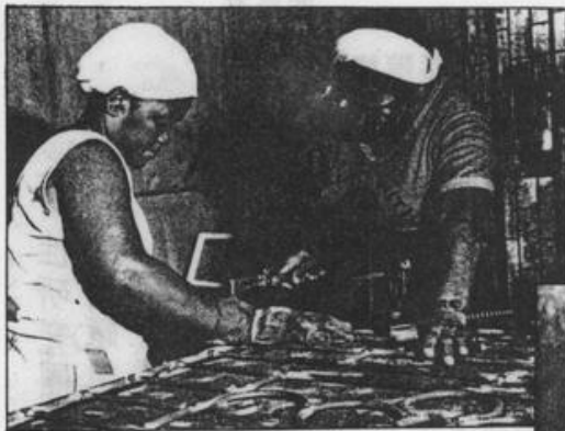
數以萬計的第三世界勞動婦女普遍面臨工作平等、育兒等問題。

罪，因為那是趁她軟弱無力的時候犯下的。我們無論男女都不責怪被強暴者，不認為被強暴是她的錯。