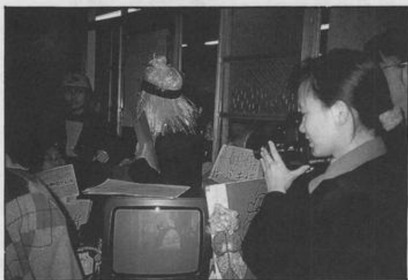
三八國遊會當天，全女聯〔老實說〕遊戲攤位。

聯絡方式：中大、福爾摩沙社信箱 515 （因稿擠，下次續刊北醫文化社女研組及東海女研社，僅此致歉！）