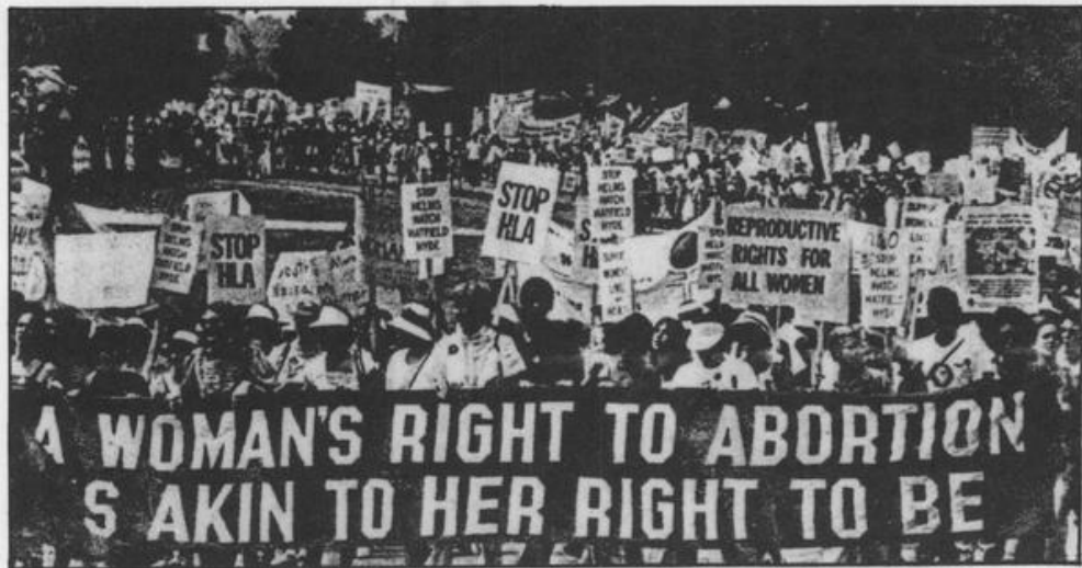
墮胎自主權乃婦女之人格尊嚴，不得侵犯。

也有人說，女人應對自己的性行為負責，開放墮胎會帶來性氾濫，若照此說法，所有避孕措施如避孕藥、保險套、子宮內避孕器、結紮等，都可使性行為無懷孕之虞，且更加方便，政府卻大力推廣，豈不和限制墮胎矛盾？再說，性氾濫、性紊亂乃肇因於性教育體系的不健全，性知識的