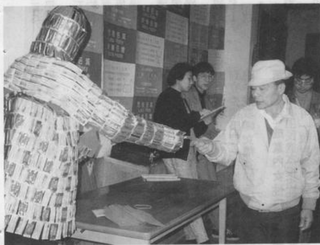
AIDS 防治義工、發送保險套