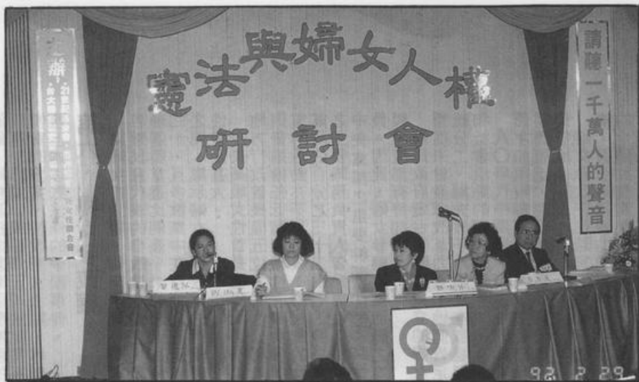
研討會實況：婦女參政權

“性別”而在人身安全上受到特別的待遇，如：男嬰優先存活、殺害女嬰、火燒新娘、販賣婦女兒童、女奴隸、郵購新娘、婚姻暴力、強暴、性