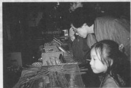
小朋友和媽媽一起歡度三八