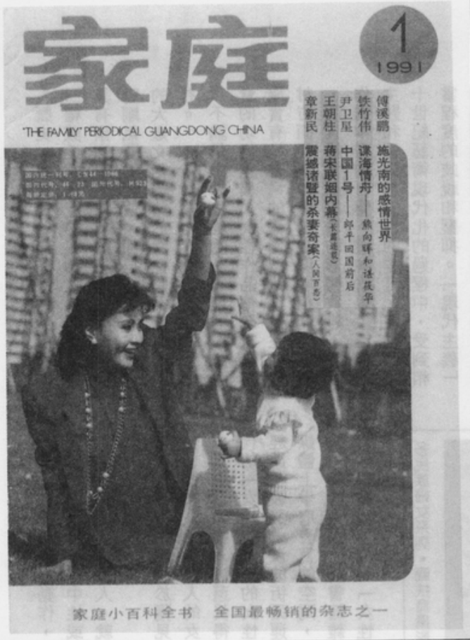
家庭小百科全書 全國最暢銷的雜誌之一