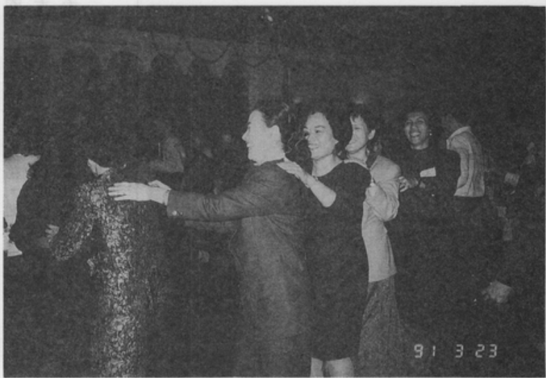
離婚也可以做個快樂女郎

和學姊走進玉英位於福民住宅區的住處，一眼看到約四坪大的客廳放著腳踏車、床鋪、餐桌和其它的雜物，顯得有些凌亂，狹小的空間令人感到