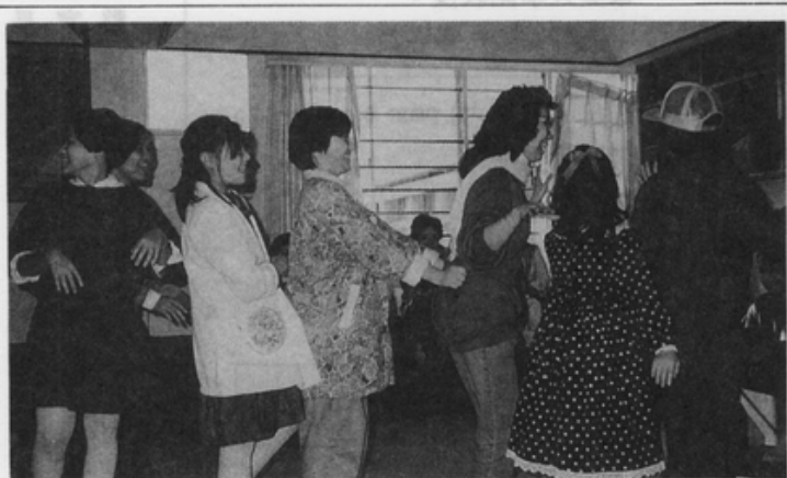
單親媽媽 尤應重視 親子溝通

不僅單親母親的賺錢能力低，家庭中受撫養人口的比例也比雙親家庭高，一般而言，從無監護權的父親所得到的撫養費卻很少。在美國對於無小孩監護權的父親應負擔多少撫養小孩的費用，已有許多討論，但這項制度缺乏法律強制性，是否能夠執行徹底仍是一個問題。在我們訪問的單親媽