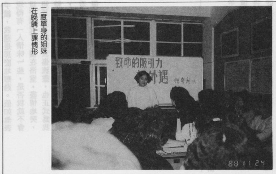
一度單身的姐妹 在晚講上課情形