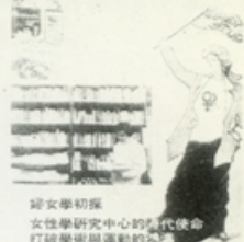
婦女學初探 女性學研究中心的時代使命 打破學術與運動的鴻溝