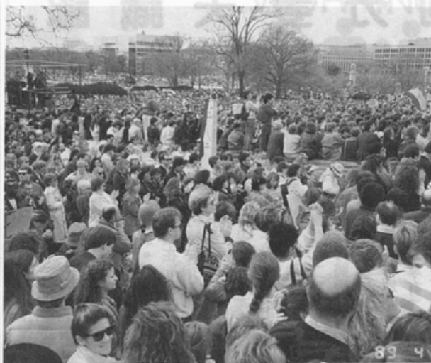
六十萬人齊集華盛頓特區要求墮胎合法化。

re Hangers) 的招牌。有一群人甚至將一名因自己墮胎流血過多慘死的汽車旅館的女性跪死在一灘血水的照片製成貼紙，貼在背上。