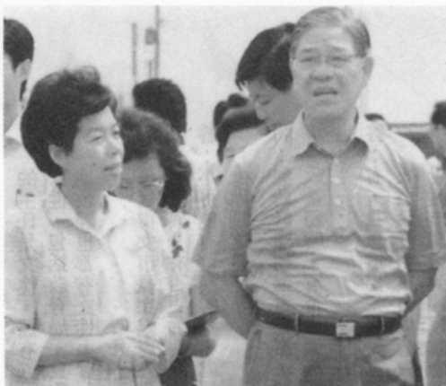
李總統巡視嘉義市建設