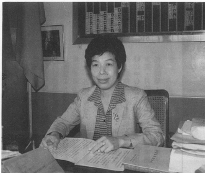
張博雅市長對員工瞭若指掌，由背繪資料可見一斑。

的主任是女性，還有五、六位科股長是女性，包括教育局、民政局、財政課、地政課也都有女性主管。