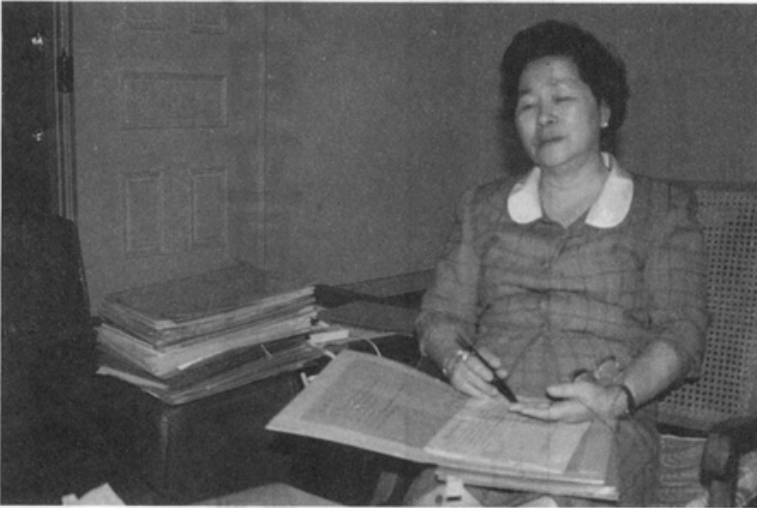
余陳縣長每日要親閱大批公文，連接受訪問時也手不停批。

社，及女學生、學校輔導室的老師、縣政府的女性員工，還有老人會的會員參與掃黃運動。至於後續活動，則繼續關心如督促環保局、警察局加強色情海報的取締，以及學校方面的教育。