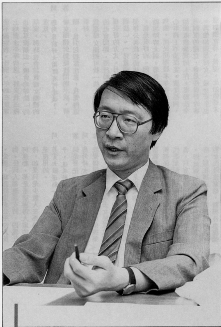
■稅務改革的促成者——趙少康。