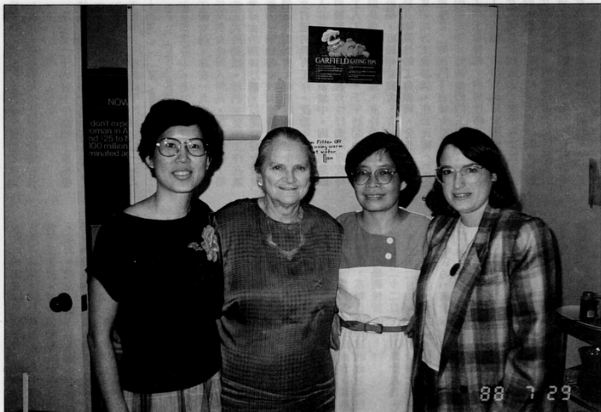
■與Now的現任主席及秘書合照。

(B)七月十八日在克利夫蘭(Cleveland)參觀訪問了「婦女投票聯盟」(League of Women Voters)，七月二十七日在華盛頓特區(D.C.)參觀訪問「婦女投票聯盟」總部，八月四日在脫比克(Toronto)與當地的婦女投票聯盟會長、共和黨女性州參議員、年輕女性義工創會人聚餐交流，收集了不少投票聯盟的工作資料、年度報告。此組織是在一九二〇年美國婦女爭取到憲法保障的投票權之後成立的，至今已有一百六十八年，她們全美各地的組織很大而良好，在各地做教育選民的工作，最早是教育婦女選民去投票，其次是教育黑人選民、現在則着重教育年輕選民去投票，另外她們在各州各地區及全國都舉辦「候選人政見會」、也替各民意代表、政府官員在各項政績上製表列出其績效(並不排名)，讓選民參考，在候選人政見會上，此組織亦完全超黨派、持中立態度，只是給選民參考機會