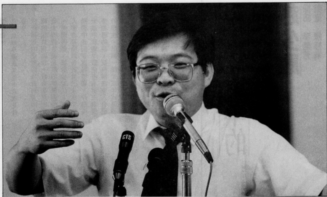
■臺灣的啟蒙運動家——朱高正立委。

答：你們可以辦「婦女大學」之類的講習營。像德國的婦女夏日大學，就在柏林大學內，每年十月份的第一個禮拜，整個禮拜舉辦。婦女新知可朝這方面來做，你們可選在八月最後一個禮拜整個禮拜舉辦。事先洽商台大租借演講廳、討論教室，然後規定只有女性才能參加，講員全是女性。每年選定一個主題，可盡量去調小學教師來，提供他們食宿補助，這可與教師會館合作。因小學教師基本上都有相當教育程度，可請人從社會學、文化人類學觀點來談，相信對於一個新的現代社會婦女應有的行為模式及自我教育是何許重要等各方面，絕對有很大的幫助。