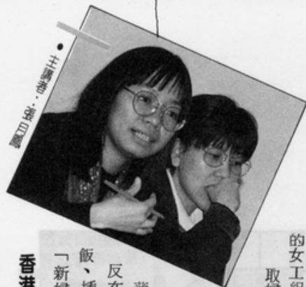
香港婦女協會成員