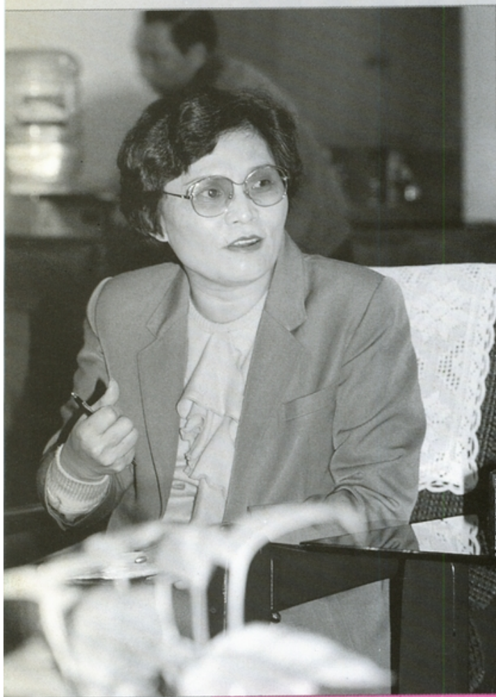
• 政壇鐵娘子／許榮淑立委•