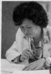
一個人專心思考及工作