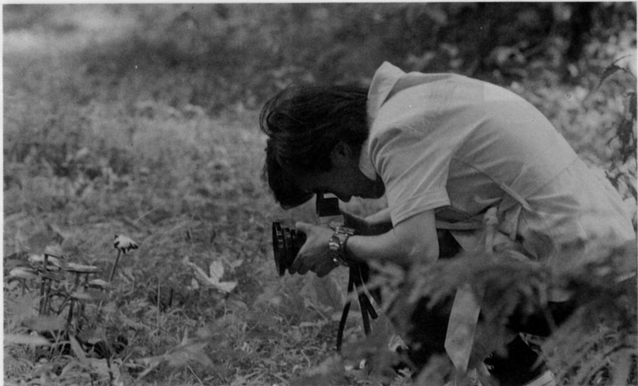
民國六十一年訪霧社時專心一致的拍攝小蘑菇

生卻不可以？」所以從小就很皮，由於先天體質較弱，母親也就不怎麼約束她的行爲。爬樹、比劍、打架，還曾經穿越台中市繼光街附近的地下水溝，整條鑽過。「媽媽不會刻意的規範或誘導，使我得以自由無憂地過完童年；我從小就不玩洋娃娃，我玩劍、玩布袋戲、玩一切男孩愛的事物及活動……」。