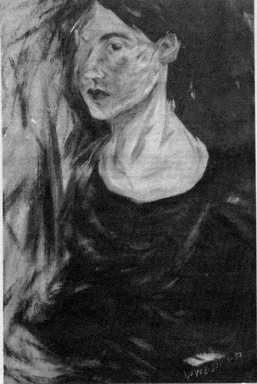
香港新婦女協會製作。

六月二十一日起，此國際會議繼續在中南部大學城海德堡展開六天的活動。其主題為「東西女性作曲家」，着重點是美國、蘇俄、西德、波蘭、羅馬尼亞。配合此項會議，在海德堡同時舉行了第四屆國際音樂節「女性作曲家，昨日—今日」(Komponistinnen gestern-heute)與第一屆民族音樂學會議「音樂與性別」(Music and Gender)。「女性作曲家，昨日—今日」乃「婦女與音樂」