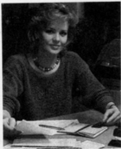
當許多婦女察覺到升遷，發展無望時，乾脆就把所學拿來開創自己的事業。

美國目前有一千三百萬個私人企業，其中至少有三百七十萬個老闆是女性。這個數字比起十年前的一百九十萬，差不多增加了一倍。根據預測，到本世紀末，女企業家的人數將會達到總數的一半。