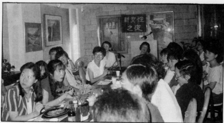
●呂秀蓮在六月十七日的新女性之夜中，再次呼籲婦女在明年的選舉中扮演中介角色。

結合社會意識、政治意識影響立法。在此，我特別呼籲大家注意明年年底的六項選舉。在父權社會之下，選舉並無多大意義，如果政治代表巔峯，是小人因緣以得利的途徑，那麼，女性不參與也罷。但是，今天我們面對的是台灣社會的大動盪，新的社會文化有待重建之際，如果女性依然袖手旁觀，將來創造出來的社會文化、政治制度，依舊是Man-Made（男人制定的），對女人沒有好處。在這個新時代來臨的時候，如果女性好好把握這