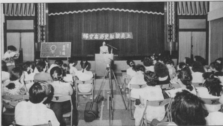
惟有女性也積極起來爭取權利，民主平等、兩性平權的目標才能一舉完成。

美國婦運史上有一段彌足珍貴的經驗值得我們借鏡，十九世紀末，由於一些白人婦女基於人道的精神投入黑奴解放運動的行列，而掀起第一波婦運。但是，當世界反奴役大會在倫敦召開時，由美國千里迢迢趕來的婦女代表，卻被拒於大門之外。這時她們才警覺到，雖然她們是參與黑人解放的白人，但是就因為她們是女人，於是受到了男人、各種族男