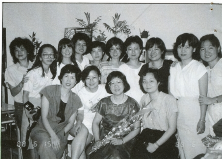
● 舊雨新知共聚一堂

。(自立晚報·七十七年五月廿八日) △經濟部物價督導會報導集內衣業者，討論進口內衣售價問題，希望業者能合理反映關稅降低，但遭到拒絕。(中國時報·七十七年五月廿九日) △美國一項研究報告顯示，婦女在懷孕時從事較激烈的有氧運動，可能使胎兒心跳減慢，送達胎兒的氧氣也可能減少。(自立早報·七十七年五月廿九日) △石化王國台塑在招考人才時排斥大專女生。(中國時報·七十七年六月二日)