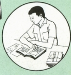
教科書插圖所顯示的性別差異