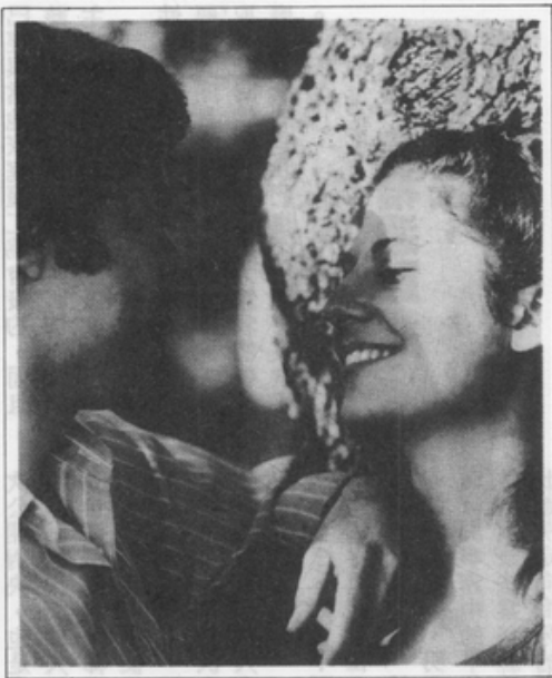
題目傳情是 男性常忽略的 感官經驗

僵化的性別角色不僅限制女人，也限制男人。為了做個標準的男子漢，多少男人失去了選擇的自由，被金錢、地位所奴役，辛苦而惶恐地在兩性關係中採取主動，不自然地壓抑感情外露，為責任牽絆而放棄理想。他們不見得喜歡承擔扮演強者的壓力，只是責無旁貸。