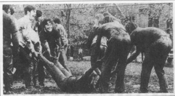
男性對成功的定義是：打敗別人

女手指接觸的特寫鏡頭。紐約性愛電影節選出來的最佳影片中只有一部是女性製作的，它以特寫方式拍攝一顆橘子的剝、摸、捏、吃等鏡頭，由於都是特寫，橘子看起來彷彿是人體的一部分，引人遐思的程度令人難以置信。