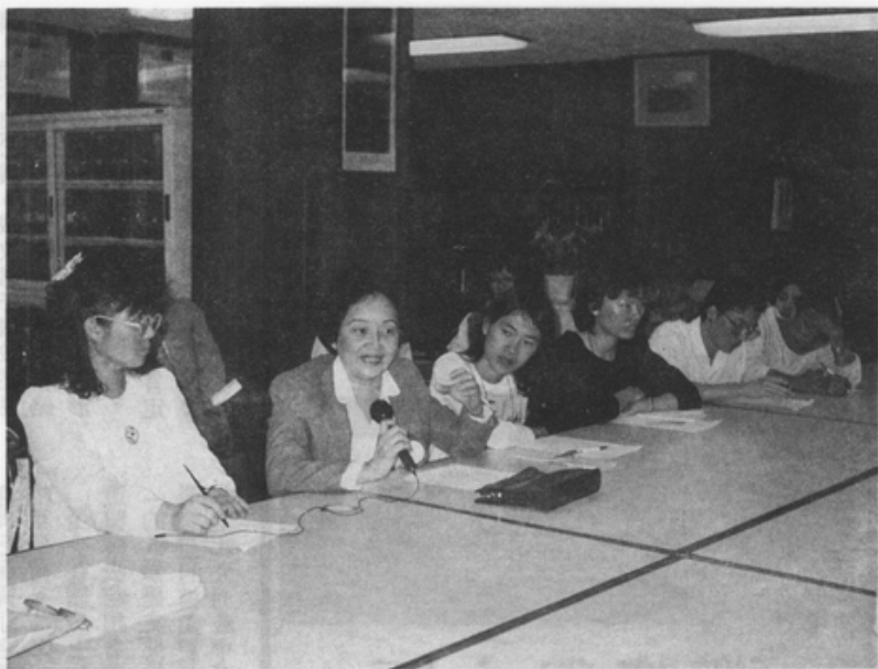
研討會 進行中的實況

這法庭談判的壓軸戲是戲劇史上罕見的、至為雄壯而又感人至深的一幕。雅典娜一方面以宙斯的無上意旨，以及他的足以摧毀一切的武器，作為後盾；另一方面，她展開苦口婆心的