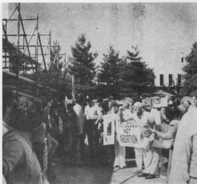
左側的婦女志願工作者排成一列，面對反墮胎者的咆哮，以便讓一位患者順利進入診所。