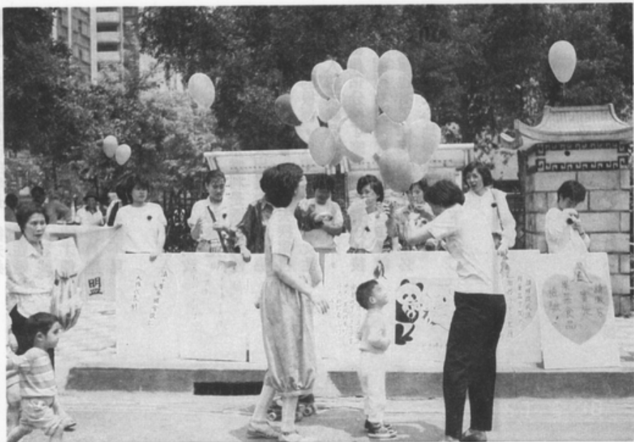
進步婦聯母親節的活動

第十：天下沒有一個母親願意看著自己辛苦教養長大的兒女，走上戰場，變成炮灰，請用追求和平、揚棄戰爭，以及充分實施民主憲政的原則來作為我們最高的國策。