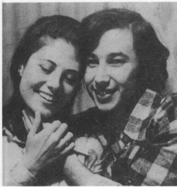
柔體體貼的男性可 充份享有兩性 美好的親密關係

我在研究工作中發現，男人起初多半把這些事情視為芝麻小事。他們寧可聽一場社會問題的辯論，也不去思考自我成長的問題。我愈深入研究，愈發現拒絕成長、自我設限的男人有