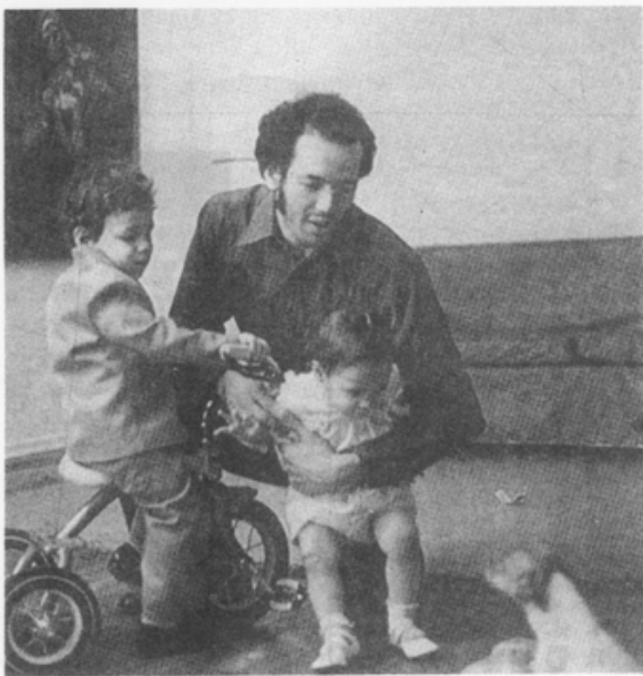
男人分擔家事與 孩子養育責任， 可使婚姻更美滿。