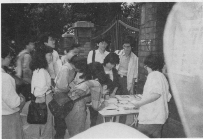
簽名現場井然有序

說，漸漸地人潮一波一波的聚集，有些父母携兒帶女來簽，有些學生跳下單車來簽，更有些熱心的年輕人幫著在旁邊吆喝，吸引更多的行人來簽。有一個有趣的現象，越接近收攤的時間，人群來得越踴躍，往往要拖到近六點才能結束。