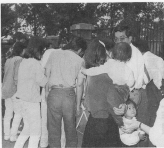
民衆携兒帶女齊來響應

誰說社會群衆是冷漠的？只要你使其有參與的管道及機會，每個有血性的人，都會義不容辭的襄助；遊行如此，簽名更是如此。總計兩天來，五個攤位就彙集了一萬四千多個簽名，比預期目標——一萬個簽名，已超出甚多；預定五月底前，將會同「法案修訂小組」修正後的法案條文，一齊呈送立法院，請立法委員們重視及解決雛妓的問題。