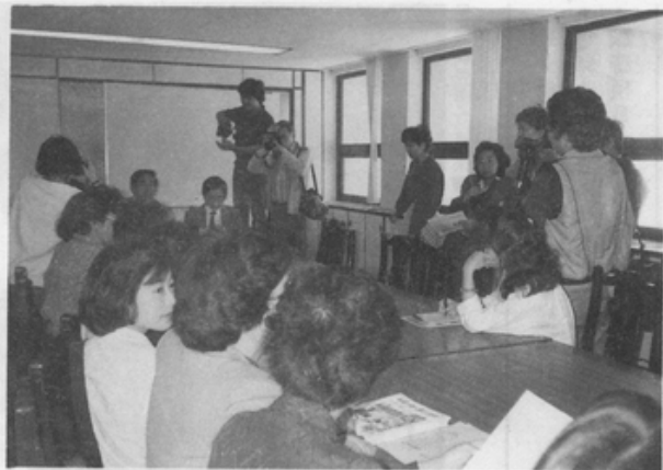
新聞媒體爭先報導現場進行實況