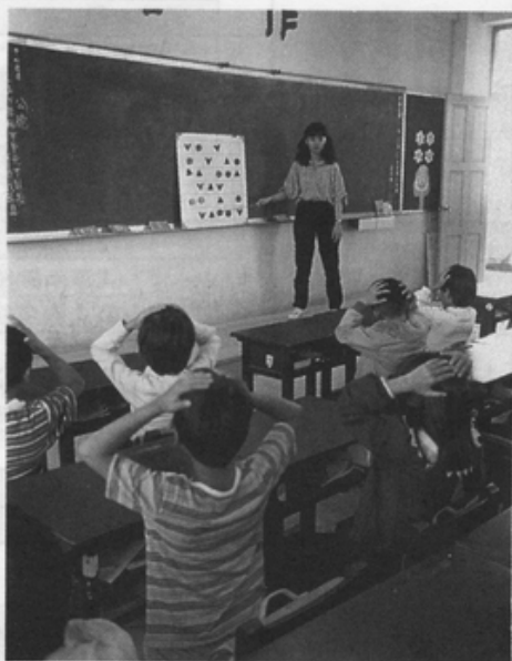
小學教職經常有「男性保障名額」的呼聲

：政府從未重用婦女當部會首長，充分顯示忽視女權，男尊女卑意識有待改良。(11.29.中央日報)