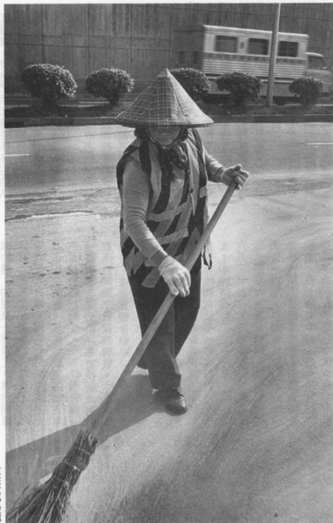
女性大多從事 清潔性的工作

△國建會教育文化組人力規劃討論時，旅美代表季誠說，婦女就業遭到歧視，浪費了不少勞動力。政府與國營企業不如率先示範，以合理的比例任用