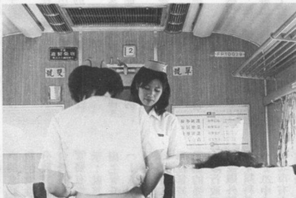
鐵路局女隨車服務員須在結婚時辭職

到去年十月為止，我國的職業婦女人數已接近三百萬名。十五歲以上的婦女中，有將近一半人口活躍在就業市場上。職業婦女增加，始自五十年代中期，我國經濟由農業轉變為工業的時期。由於經濟發展、國家徵召、和女性自己的努力，女性勞動參與率與率在二十年間提高了約百分之三十五。