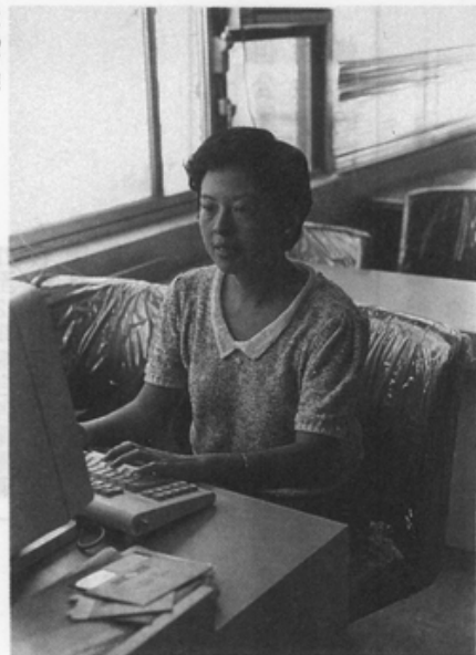
資訊行業 多指定要男性， 對女性缺乏 適用的平等

百一十人，僅佔女性公務員總數的百分之零點零八，顯示我國女性在行政機關中的職等偏低。(4.23.聯合報) △新任行政院長俞國華受命組閣，有人在報上呼籲應有女性部長，但組閣後的中央部會首長仍然清一色是男性。(6.20.民生報) △省公賣局花蓮酒廠招考女性酒類包裝工及事務、服務工，在簡章中規定女性已婚者需未孕，並應在體檢表上註明「未孕」。(6.28.中國時報) △立法院於七月十九日通過勞動基準法，咨請總統公佈實施。 △勞動基準法於八月一日正式實施。爭議最多的「適用範圍」最後僅包括： ①農、林、漁、牧業 ②礦業及土石採取業 ③製造業 ④營造業 ⑤水電、煤氣業 ⑥運輸倉儲及通訊業 ⑦大眾傳播業 ⑧其他往中央主管機關指定之事業。 依此規定，只有約三百萬名勞工能受勞基法保護。婦女參與甚多的商業、金融、保險、不動產及工商服務業、個人服務業等，均不受勞基法規範。