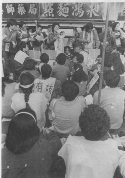
在華西街靜坐抗議

近代婦女開始受教育，不少貧窮婦女因有就業能力及機會而免淪為娼妓。但婦女的就業情況仍比男性低落太多，婦女靠能力而拿高薪的機會仍被各種社會條件所局限。一旦為經濟所迫，只有從事色情行業，可以較快賺到較多金錢。許多愚昧的父母也承襲了以女兒的身