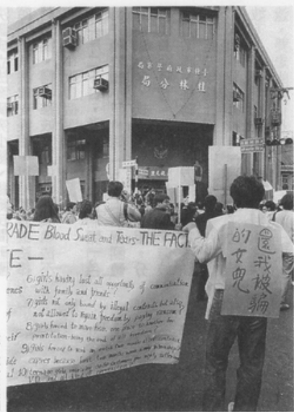
隊伍最後來到 桂林分局前

原住民原屬台灣的主人，但今日台灣整個社會，並未給予原住民自有的文化傳承相當的尊重及人性平等的尊嚴，對原住民的地位與權益未給予法律保障。山地政策的各項「法規」，因年久失修，存有許多不合時宜，與山地社會現實