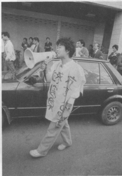
「山地少女是我們的姊妹！」 (簡扶育攝)

塞滿滿在小黑巷裏的我們，心被撕裂了，不爭氣的眼淚偷偷的溢出眼角，騰出舉著「反對販賣人口」標語旗的左手拭掉它，又是一顆不爭氣的落下來。瓊遞過來一張化粧紙，感謝她的靈巧。淚竟然無法遏止的成串的落著，凝結的空氣裏，朋友們一個個默默的擦拭著面頰，一個女孩不自禁的將她悲傷的臉埋在同伴的懷裏，山地少女的呼喚成了一聲聲悲憤的控訴。