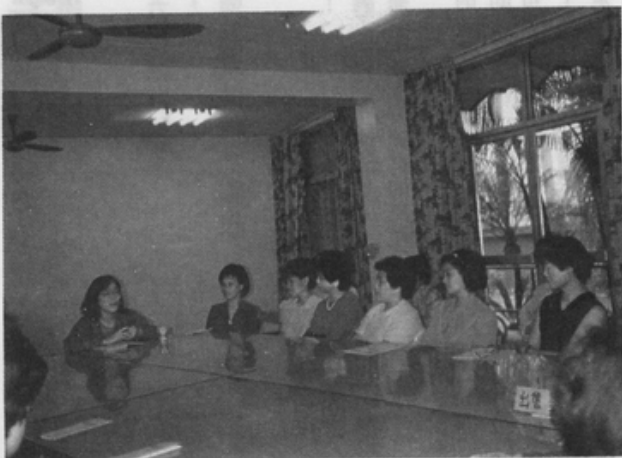
主婦成長聚會進行了將近一年，目前正面臨突破的瓶頸

識的期盼與再就業的動機較強。例如有一位中文系畢業的朋友，由於常到婦女新知雜誌社，和編輯人員有較多的接觸之後，她對自己的生涯計劃有了構想。她由收集資料的義工做起，由工作中學習，除了在家中練習寫文章之外，並開始採訪，學習編輯經驗，她相信累積這些學習經驗，有助於她日後回到就業市場。另一位朋友在衡量過自己的興趣與家庭情況之後，