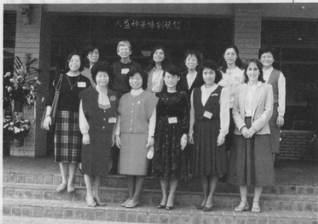
女傳教師參加長老會年會

為培養信徒的信德等；要執行這樣的職務，就必須具備有好的信仰，謙卑、仁慈的品德及願意服侍上帝和服務人的心。我想這些條件的具備，女傳道人並不遜色於男傳道人。 當然，女傳道人是有一些角色的限制，不便單獨探訪單身的男信徒，與男性長執或信徒間也不便有太頻繁的交通（但不幸的教會當權的長執又以男性居多），去探訪不能太晚回家（不便走夜路），可能也得考慮牧師館居住的安全性等。對於這些角色上的難題，我想只要多用點心，是可以克服的。因為成為人就有人有的有限性，我想男傳道人同樣有一些角色上的限制才是。至於其他方面