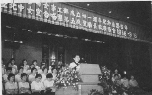
女神學生愈來愈多，將來會有更多女牧師出現